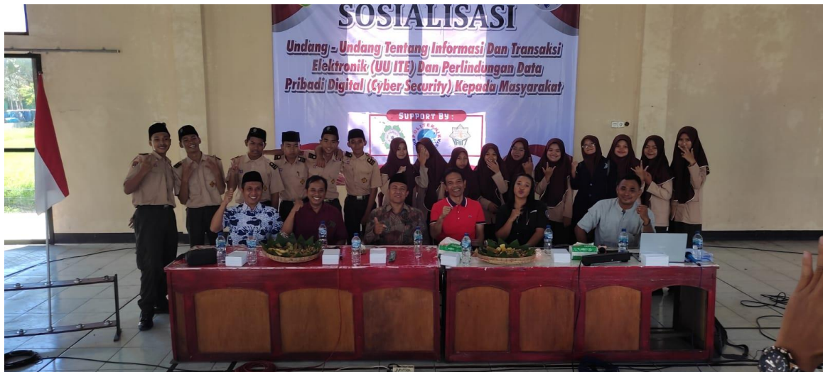
Gambar 6. Dokumentasi Kegiatan Pengabdian Kepada Masyarakat