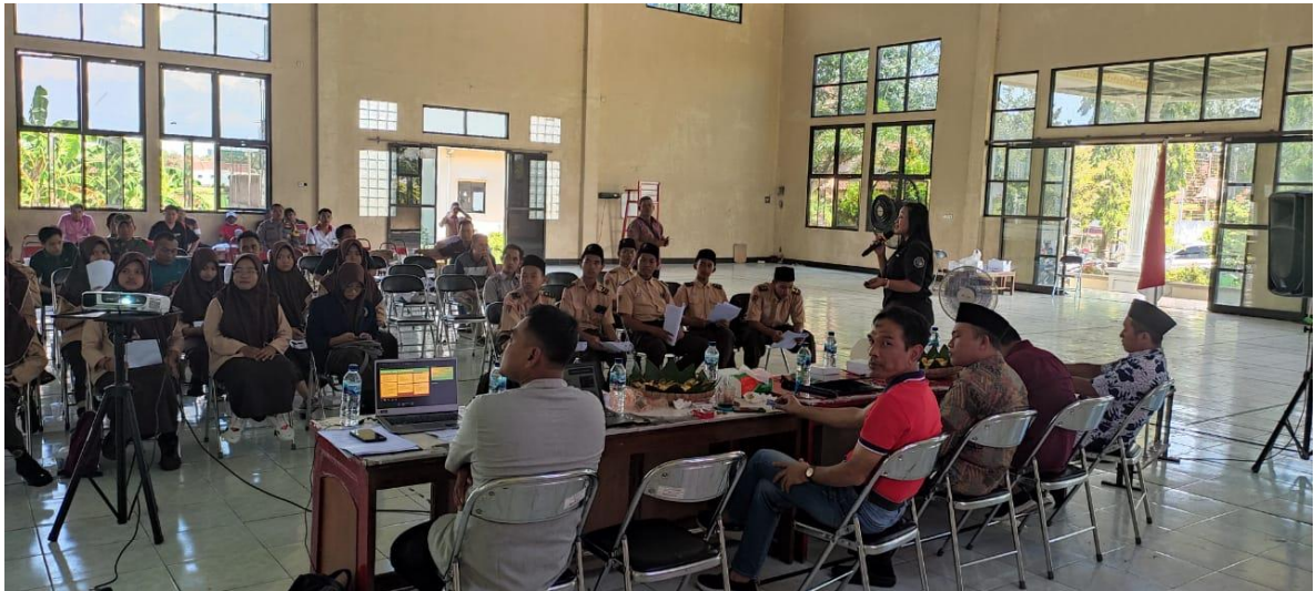
Gambar 4. Edukasi Aman dan Kreatif menggunakan Media Sosial