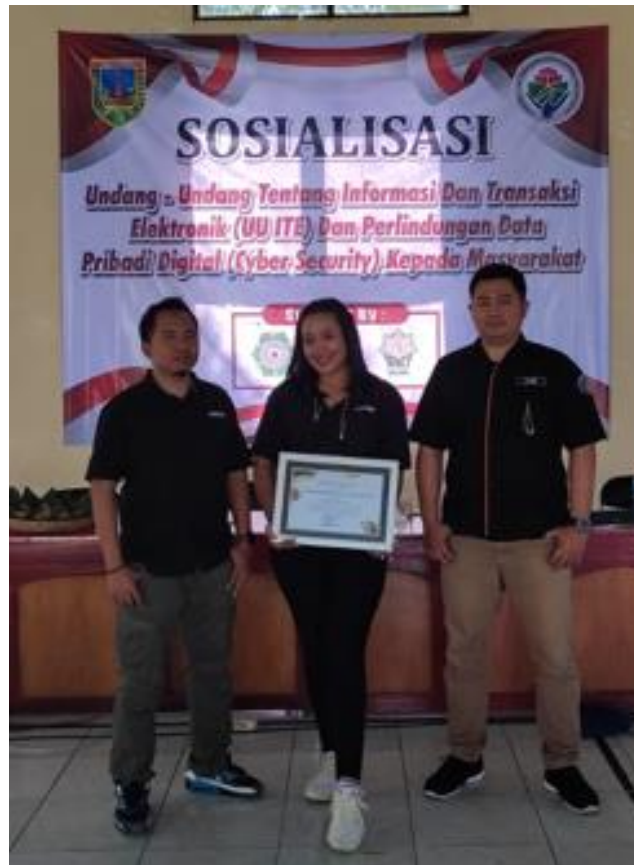
Gambar 5 Dokumentasi Kegiatan Pengabdian Kepada Masyarakat