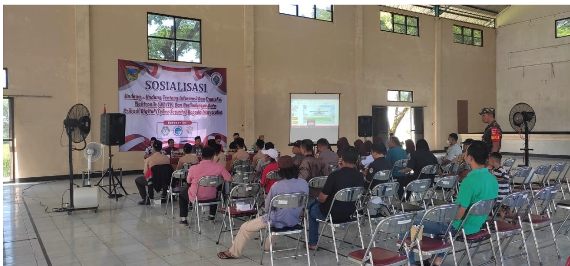
Gambar 3. Edukasi Tentang kejahatan Digital