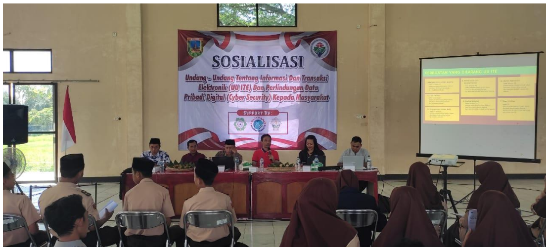
Gambar 2. Sambutan Kepala Kejaksaan Negeri Kudus