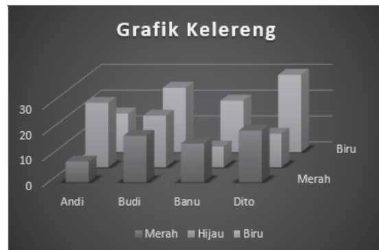
Gambar 7. Contoh Pertama Hasil Latihan Peserta