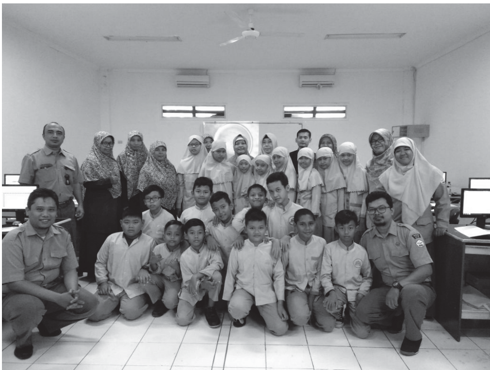
Gambar 2. Tim Pelaksana dan Peserta Pengabdian Kepada Masyarakat Hari Pertama

Pendampingan pelatihan penggunaan Microsoft Word untuk membuat desain artikel artistik bagi siswa siswi kelas 5 SDIT Salsabilla Al Muthi'in dengan menggunakan Microsoft Word dilaksanakan di Laboratorium Multimedia Sekolah Tinggi Teknologi Adisutjipto (STTA) Yogyakarta pada bulan Mei 2018. Pendampingan dilaksanakan selama sembilan jam, sesuai waktu yang ditargetkan. Peserta kegiatan berjumlah empat puluh satu siswa.