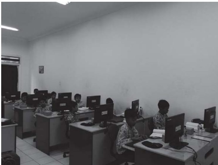
Gambar 4. Kegiatan Peserta Pengabdian Kepada Masyarakat