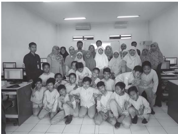
Gambar 3. Tim Pelaksana dan Peserta Pengabdian Kepada Masyarakat Hari Kedua