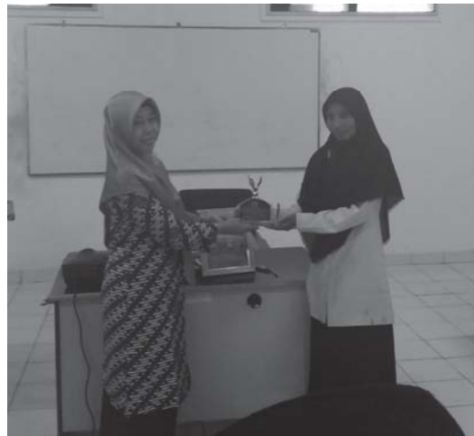
Gambar 6. Penutupan Kegiatan Pengabdian Kepada Masyarakat

Setelah materi pelatihan selesai, pada hari terakhir disediakan waktu kurang lebih dua jam untuk para peserta mengerjakan latihan guna menguji pemahaman materi secara keseluruhan. Adapun setiap peserta diminta membuat desain artikel artistik sesuai kreativitas masing-masing. Salah satu contoh hasil pembuatan desain artikel artistik dapat dilihat pada Gambar 7 dan Gambar 8.