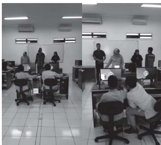
Gambar 5. Pembukaan Kegiatan Pengabdian Kepada Masyarakat