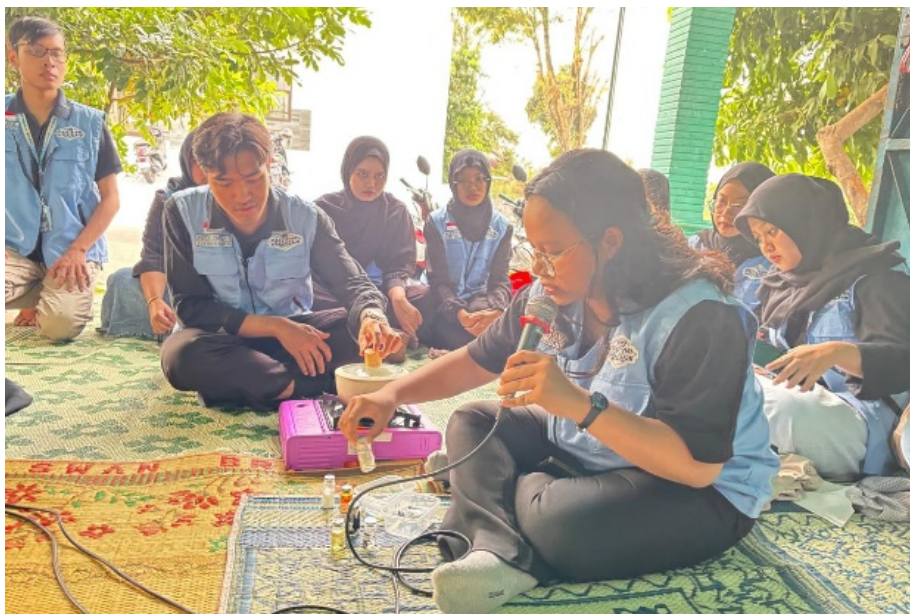
Gambar 2. Sosialisasi pembuatan shampo herbal kepada masyarakat