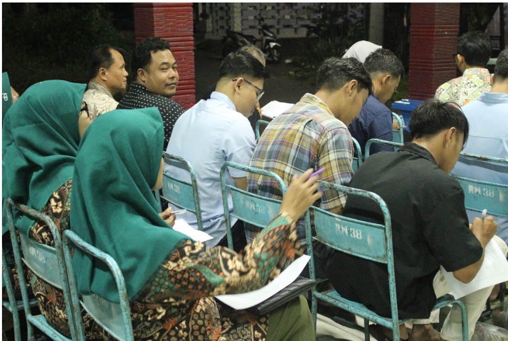
Gambar 5. Sesi pretest dan posttest

bahan alam, termasuk potensi reaksi iritan, jangka waktu penggunaan produk, dan tanda-tanda yang harus diwaspadai pengguna. Penyampaian langkah-langkah tersebut membantu mencegah penyalahgunaan dan pemborosan sumber daya alam yang berpotensi terjadi bila ekstraksi atau formulasi dilakukan tanpa panduan teknis. Pendekatan seperti ini konsisten dengan praktik pengembangan produk herbal yang direkomendasikan dalam studi formulasi antiketombe dengan kontrol kualitas dan parameter organoleptik menjadi penentu keberterimaan produk [16], [17]. Dalam seminar ini juga terdapat diskusi mengenai epidemiologi lokal mengenai masalah kulit kepala yang dikaitkan dengan Malassezia sp. di wilayah tropis sehingga masyarakat memahami urgensi intervensi preventif dan terapeutik berbasis sumber daya lokal. Pemahaman tersebut dapat meningkatkan masyarakat untuk menerapkan praktik yang aman dan berkelanjutan.