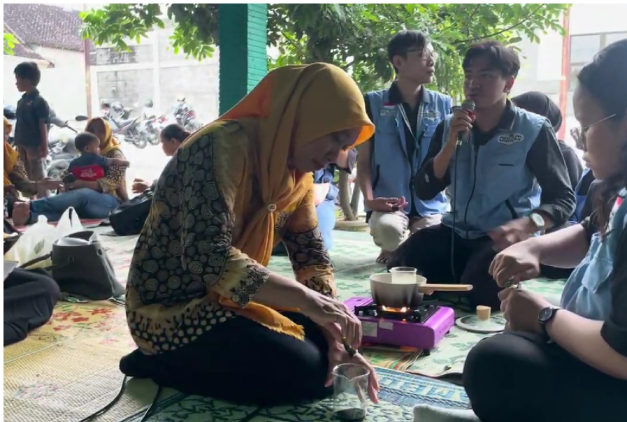
Gambar 3. Praktik langsung pembuatan sampo oleh salah satu ibu PKK