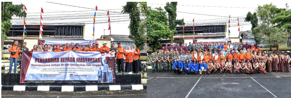
Gambar 1. Tim PKM UEU dan Unhan Berfoto Bersama Penyelenggara Kegiatan PKM

Oleh karena itu, penting dilakukan penyuluhan untuk mengedukasi tentang gizi. Media komunikasi visual telah terbukti dapat meningkatkan pemahaman masyarakat mengenai pentingnya gizi. Kegiatan Pengabdian Masyarakat melalui penyuluhan tentang pentingnya gizi dilakukan pada tanggal 24 Mei 2025 di wilayah Desa Palasari, Kecamatan Cijeruk, Kabupaten Bogor, sebagai representasi wilayah dengan potensi masalah gizi dan tantangan komunikasi kesehatan. Dokumentasi kegiatan ditunjukkan pada Gambar 1 .