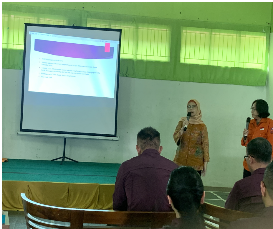
Gambar 3. Penyuluhan Tentang Pentingnya Gizi