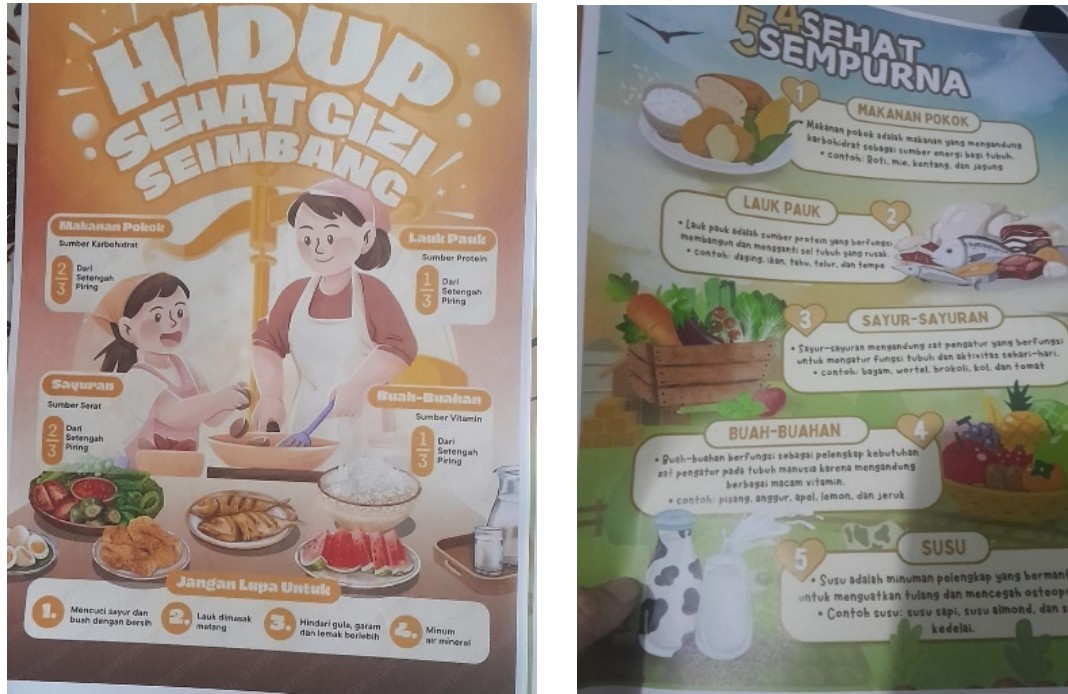
Gambar 2. Poster Hidup Sehat Gizi Seimbang dan Poster 4 Sehat 5 Sempurna

Jumlah peserta yang kurang dan waktu pelaksanaan yang singkat menjadi keterbatasan kegiatan ini. Pelaksanaan penyuluhan dilakukan sewaktu ( post ) dan bersamaan pula dengan waktu pengisian kuesioner oleh peserta penyuluhan.