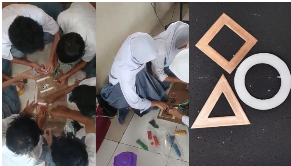
Gambar 5. Pematangan bahan baku dan pembuatan cetakan sederhana

Selanjutnya peserta diberikan penjelasan dan praktek cara membuat cetakan sederhana yang akan digunakan dalam praktik pengepresan. Dalam sesi ini, dijelaskan pula bahwa pada proses daur ulang limbah plastik HDPE skala industri, cetakan biasanya terbuat dari bahan logam dengan proses injeksi, yaitu plastik HDPE yang dilelehkan kemudian disuntikkan ke dalam cetakan dengan bentuk tertentu. Selain itu, bentuk cetakan yang lebih sederhana dapat dibuat dari plat logam untuk teknik tuang panas, atau menggunakan wadah stainless steel yang dipanaskan untuk proses pemanasan menggunakan oven sebelum plastik dipress. Prinsip utama dari cetakan adalah membentuk plastik selama proses pendinginan, dengan syarat utama alat cetak adalah bahan yang tahan panas dan tidak lengket pada plastik. Gambar 5 , memperlihatkan kegiatan peserta sedang mempersiapkan cetakan sederhana yang digunakan dalam kegiatan ini pengabdian ini. Cetakan yang digunakan merupakan cetakan sederhana berbahan karton yang telah dilapisi dengan kertas teflon atau kertas minyak, agar plastik tidak menempel dan hasil cetakan dapat dilepaskan dengan mudah. Pendekatan ini tidak hanya aman dan murah, tetapi juga memberi pemahaman kepada peserta tentang prinsip dasar teknik cetak dalam skala industri melalui versi yang lebih sederhana dan berbasis teknologi tepat guna.