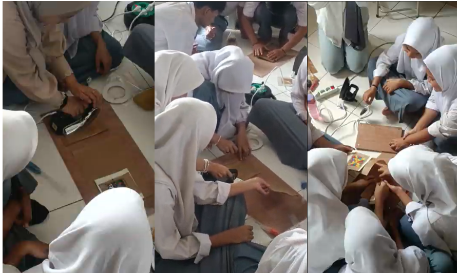
Gambar 7. Peserta melakukan pengepresan