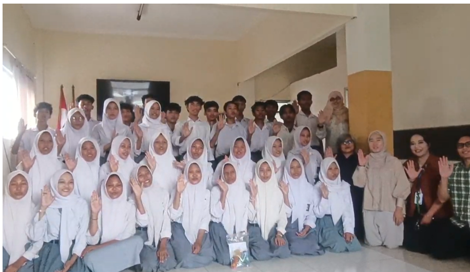
Gambar 9. Peserta dan tim pengabdian

Secara keseluruhan, kegiatan ini membuktikan bahwa dengan pendekatan yang sederhana dan metode yang interaktif, peserta didik di lembaga pendidikan nonformal seperti PKBM dapat diberdayakan untuk memahami proses pengolahan limbah plastik sekaligus mengembangkan keterampilan dasar yang relevan dengan kebutuhan ekonomi kreatif. Hal serupa juga ditemukan dalam kegiatan diseminasi teknologi tepat guna, di mana pelatihan berbasis praktik terbukti efektif dalam meningkatkan kapasitas komunitas dalam pengelolaan sampah dan penciptaan peluang usaha lokal[22]. Kemampuan seseorang dalam mencampur warna, membentuk komposisi visual, maupun keterampilan teknis lainnya tidak muncul secara instan, memerlukan praktik berulang dan eksplorasi berkelanjutan. Hal ini sejalan dengan teori pembelajaran sosial[23] serta konsep deliberate practice [24] yang menyatakan bahwa penguasaan keterampilan teknis membutuhkan waktu, pengulangan, dan pengalaman langsung yang terstruktur. Oleh karena itu, diperlukan latihan berulang agar peserta semakin terampil dalam menghasilkan tampilan visual yang menarik, serta mampu menciptakan produk daur ulang yang lebih halus, rapi, dan bernilai jual tinggi. Hal ini membuka ruang bagi peserta untuk terus mengeksplorasi potensi kreatifnya di luar sesi pelatihan, baik secara individu maupun dalam kelompok seperti yang tampak pada Gambar 9 .