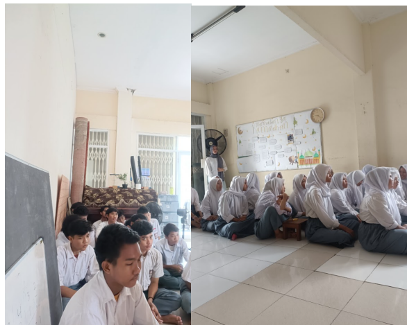
Gambar 2. Peserta mengikuti pemaparan materi.

Pelaksanaan pengabdian kepada masyarakat ini diawali dengan pemberian materi pengenalan dasar tentang limbah plastik, khususnya jenis plastik HDPE ( High-Density Polyethylene ) dan PET ( Polyethylene Terephthalate ), sebagaimana Gambar 2 . Sesi ini berlangsung secara interaktif, dimana peserta tidak hanya mendengarkan pemaparan materi, tetapi terlibat aktif dalam diskusi kelompok. Setelah pemateri menjelaskan macam-macam jenis plastik HDPE, pemateri juga mengajak peserta mengidentifikasi berbagai contoh plastik HDPE lainnya yang mudah ditemui di lingkungan sekitar seperti jeriken plastik, botol sampo, botol sabun cair, botol oli dan lain sebagainya.