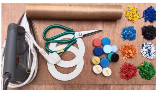
Gambar 3. Bahan material dan alat

Untuk mempermudah kegiatan praktek, pada tahap praktek peserta dibagi menjadi enam kelompok. Masing-masing kelompok mendapatkan bahan material dan perlengkapan yang akan digunakan bergantian, sebagaimana Gambar 3 . Bahan material yang diberikan terdiri dari tutup botol plastik yang masih utuh dan delapan bungkus warna tutup botol yang sudah dicacah. Perlengkapan terdiri dari alat pengepres sederhana berupa setrika listrik, kertas teflon atau kertas minyak, papan alas, gunting, dan alat cetak sederhana. Tutup botol plastik yang masih utuh dimanfaatkan untuk praktek memotong atau mencacah botol plastik menggunakan gunting secara manual. Seluruh bahan material dan alat dalam praktek ini adalah bahan material dan alat yang secara umum dapat dengan mudah diperoleh di rumah tangga. Tutup botol sebagai bahan material utama dapat diperoleh dari limbah botol minum kemasan. Setrika sebagai alat pengepres merupakan alat merapihkan pakaian yang secara umum ada di rumah tangga dan dapat digunakan dengan mudah. Alat cetak yang digunakan terbuat dari kertas karton atau kardus yang dilapisi dengan kertas teflon atau kertas minyak yang dengan mudah diperoleh.