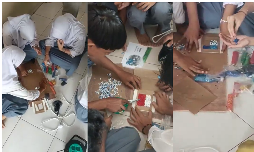
Gambar 6. Peserta menyusun warna

Pada tahap ini, peserta didampingi langsung oleh tim pengabdian yang berperan sebagai fasilitator kreatif. Tim memberikan panduan, ide tambahan, serta masukan tentang teknik pemilihan warna yang sesuai, seperti penggunaan warna kontras, warna analog, atau kombinasi warna cerah dan netral. Pendampingan ini tidak hanya membantu peserta dalam proses teknis, tetapi juga memperluas wawasan mereka terhadap prinsip dasar desain visual, khususnya dalam konteks pengolahan material bekas menjadi produk yang fungsional dan menarik. Tahapan ini menjadi momen penting dalam pelatihan karena menggabungkan unsur teknis, estetika, dan ekspresi individu secara seimbang.