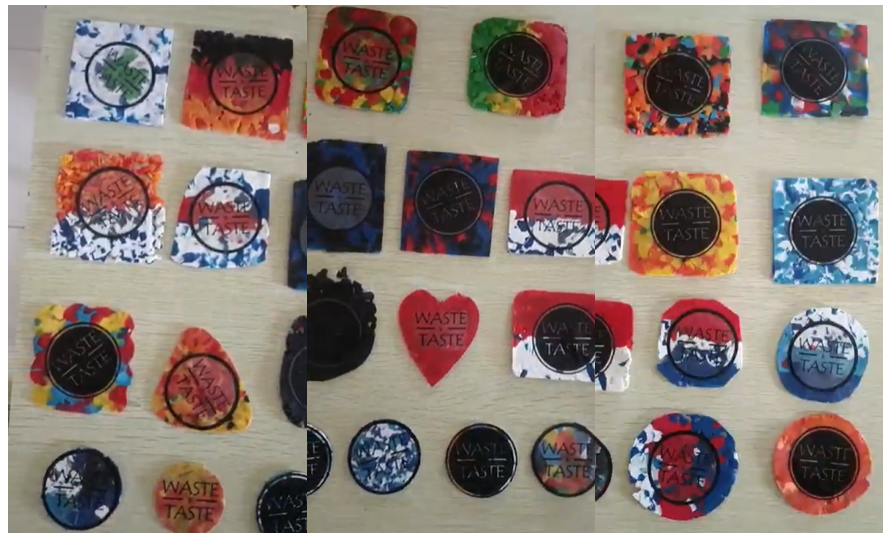
Gambar 8. Produk sederhana sebagai hasil peatihan

Secara keseluruhan, kegiatan ini membuktikan bahwa dengan pendekatan yang sederhana dan metode yang interaktif, peserta didik di lembaga pendidikan nonformal seperti PKBM dapat diberdayakan untuk memahami proses pengolahan limbah plastik sekaligus mengembangkan keterampilan dasar yang relevan dengan kebutuhan ekonomi kreatif. Hal serupa juga ditemukan dalam kegiatan diseminasi teknologi tepat guna, di mana pelatihan berbasis praktik terbukti efektif dalam meningkatkan kapasitas komunitas dalam pengelolaan sampah dan penciptaan peluang usaha lokal[22]. Kemampuan seseorang dalam mencampur warna, membentuk komposisi visual, maupun keterampilan teknis lainnya tidak muncul secara instan, memerlukan praktik berulang dan eksplorasi berkelanjutan. Hal ini sejalan dengan teori pembelajaran sosial[23] serta konsep deliberate practice [24] yang menyatakan bahwa penguasaan keterampilan teknis membutuhkan waktu, pengulangan, dan pengalaman langsung yang terstruktur. Oleh karena itu, diperlukan latihan berulang agar peserta semakin terampil dalam menghasilkan tampilan visual yang menarik, serta mampu menciptakan produk daur ulang yang lebih halus, rapi, dan bernilai jual tinggi. Hal ini membuka ruang bagi peserta untuk terus mengeksplorasi potensi kreatifnya di luar sesi pelatihan, baik secara individu maupun dalam kelompok seperti yang tampak pada Gambar 9 .