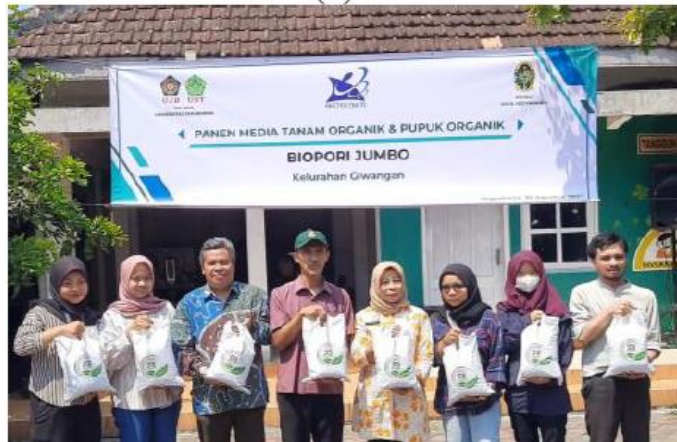
Gambar 8. Hasil Panen Kompos dengan Kemasan Kompos Siap Jual

terletak di RW 10 dan 8 yang siap dipanen pada pemanenan kompos tahap pertama. Setiap biopori dapat menghasilkan 15–20 kg kompos, sehingga dengan 10 biopori dapat dihasilkan 150–200 kg kompos. Kompos yang dipanen dari biopori disaring terlebih dahulu kemudian dimasukkan ke dalam kemasan plastik yang logonya juga dirancang oleh tim pengabdian masyarakat. Gambar 8 menunjukkan acara panen kompos yang dihadiri tokoh masyarakat pada tanggal 29 Agustus 2023, serta contoh kompos yang dikemas dan siap dijual.