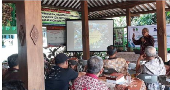
Gambar 5. Pelatihan Pengelolaan Sampah, Biopori, dan Pembuatan Kompos

Setelah pelatihan pengelolaan sampah selesai, peserta pelatihan diminta mengisi kuesioner untuk mengetahui tingkat pemahaman dan efektivitas pelatihan. Hasil angket evaluasi pelatihan dirangkum pada Tabel 2 .