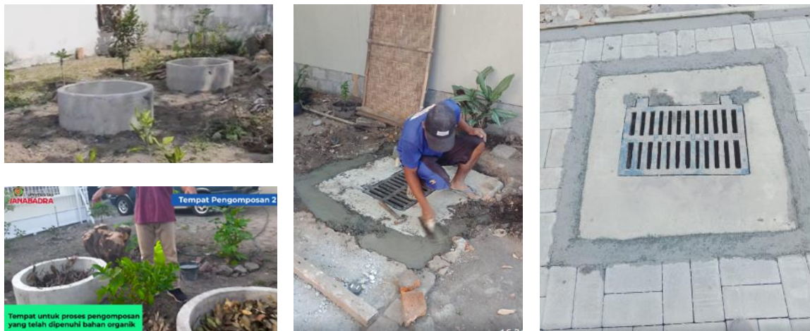
Gambar 6. Biopori di RW 10

Setelah tahap edukasi, tahap selanjutnya dari program pengabdian kepada masyarakat adalah implementasi. Pembangunan biopori merupakan bagian dari aksi atau implementasi program. Pada tahap sosialisasi, Kepala Desa Giwangan telah mengusulkan agar empat RW menjadi kolaborator program pengabdian masyarakat tersebut. Oleh karena itu, pembangunan biopori ditempatkan di empat titik masing-masing RW 6, 8, 10, dan 11, sehingga total akan dibangun 16 biopori di wilayah Desa Giwangan. Dibutuhkan waktu sekitar satu minggu untuk membangun 10 biopori sampah organik yang terbuat dari balok beton berdiameter 0,8 meter. Untuk satu biopori dibutuhkan dua balok beton agar kedalaman biopori berkisar 1-2 meter. Gambar 6 menunjukkan biopori yang telah dibangun di kawasan RW 10, sedangkan Gambar 7 menyajikan pemanenan kompos pada biopori yang dibangun di RW 8. Tahap evaluasi dalam pelaksanaan kegiatan pembuatan biopori adalah jumlah biopori yang berhasil dibuat sesuai jadwal yang telah ditentukan. Terdapat 16 biopori sampah organik yang dimanfaatkan warga untuk proses pengomposan.