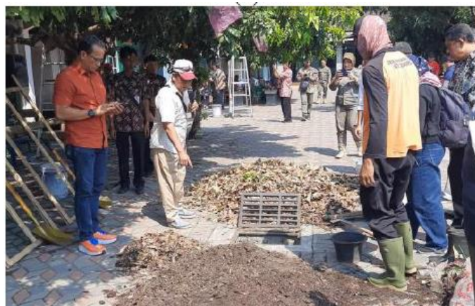
Gambar 7. Panen Kompos yang Dihadiri Tokoh Masyarakat

Setelah biopori terisi cukup dengan sampah organik, tahap pelaksanaan selanjutnya adalah proses pengomposan. Proses pembuatan kompos diawali dengan mencampurkan mikroorganisme (aktivator) ke dalam sampah organik dengan waktu tunggu sekitar 4-8 minggu hingga kompos siap dipanen. Tim pengabdian juga membuat video tutorial cara membuat kompos yang dapat diakses pada https://www.youtube.com/watch?v=Dwhf-pDoPvk .