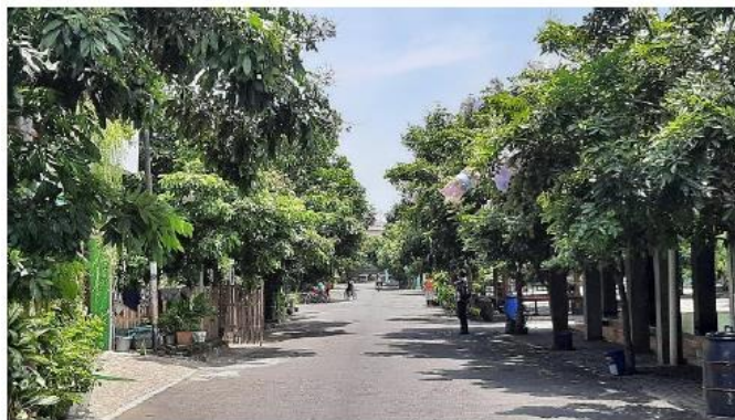
Gambar 3. Kampung Klengkeng Kelurahan Giwangan

Dalam rangka menjalankan gerakan “Mbah Dirjo” di RW lain di wilayah Giwangan dan mendorong pengelolaan sampah yang berkelanjutan, maka Lurah Giwangan meminta pendampingan dari akademisi atau universitas untuk memberikan pelatihan dan pendampingan pengelolaan sampah kepada masyarakat melalui kegiatan pengabdian masyarakat universitas. 6 Kegiatan pengabdian kepada masyarakat yang diselenggarakan ini mendapat pendanaan dari Kementerian Pendidikan, Kebudayaan, Riset dan Teknologi melalui skema Pengabdian Kepada Masyarakat Berbasis Wilayah (PBW). Kolaborasi antara perguruan tinggi, pemerintah, dan masyarakat untuk mengatasi permasalahan yang ada pada masyarakat disebut pendekatan model triple helix[15]–[18].