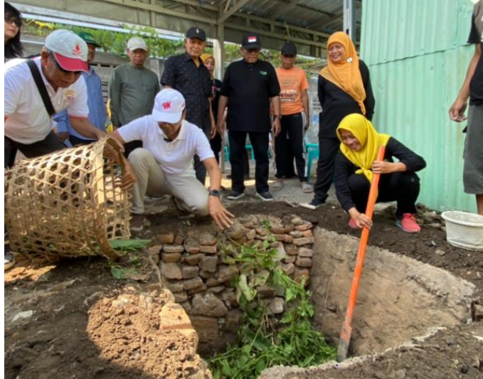
Gambar 2. Biopori “Mbah Dirjo” yang diluncurkan Pejabat Wali Kota Yogyakarta

penghijauan desa. Kelurahan Giwangan menggalakkan penanaman buah kelengkeng sehingga Kelurahan Giwangan dikenal dengan nama Kampung Klengkeng, khususnya di Kampung Sanggrahan. Tujuan penanaman pohon kelengkeng di pemukiman warga adalah untuk penghijauan dan ketahanan pangan rumah tangga. Namun biopori yang terdapat di RW 11 dan biopori yang diusung gerakan “Mbah Dirjo” masih menggunakan teknologi yang sangat sederhana. Tidak tersedia pengadukan sampah organik secara rutin atau penambahan aktivator pada biopori, sehingga pengomposan memerlukan waktu yang relatif lama, yaitu sekitar satu tahun. Gambar 2 menyajikan biopori yang diluncurkan oleh Walikota Kota Yogyakarta. Biopori yang dibuat dan diluncurkan pada gerakan “Mbah Dirjo” masih sederhana yaitu berupa lubang di tanah saja. Gambar 3 menunjukkan Kampung Klengkeng di Kelurahan Giwangan.