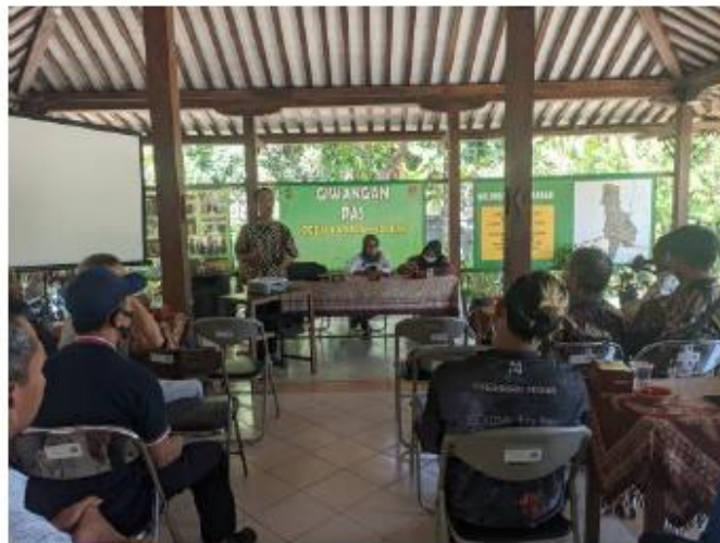
Gambar 4. Sosialisasi Program pengabdian

Ada empat tahapan dalam program pengabdian masyarakat ini, yaitu sosialisasi, edukasi (pelatihan), dan implementasi, serta evaluasi. Langkah pertama adalah sosialisasi, yaitu menyebarkan informasi tentang program ini kepada calon peserta dan kolaborator. Acara ini berlangsung di Balai Pertemuan Desa Giwangan pada tanggal 8 Juli 2023. Mitra pengabdian yang ikut serta dalam sosialisasi adalah Bu Lurah dan aparat kelurahan, pengurus RW dan warga Giwangan yang peduli lingkungan. Pada kegiatan sosialisasi, masyarakat yang diwakili oleh empat Ketua RW memberikan komitmen mendukung pelaksanaan kegiatan dengan merelakan sebagian tanah di pekarangan untuk dijadikan sebagai titik pembuatan konstruksi biopori.