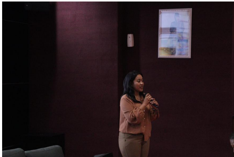
Gambar 5. Diskusi Digital Forensic Dasar