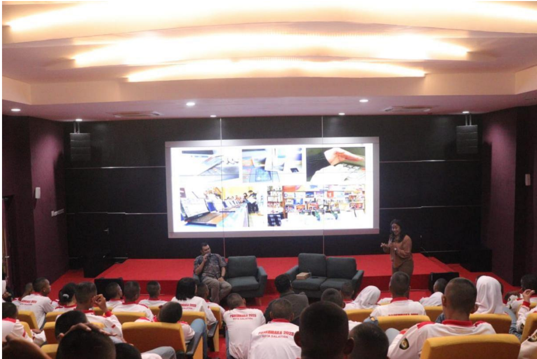
Gambar 3. Edukasi tentang Gen Z Bermedia Sosial