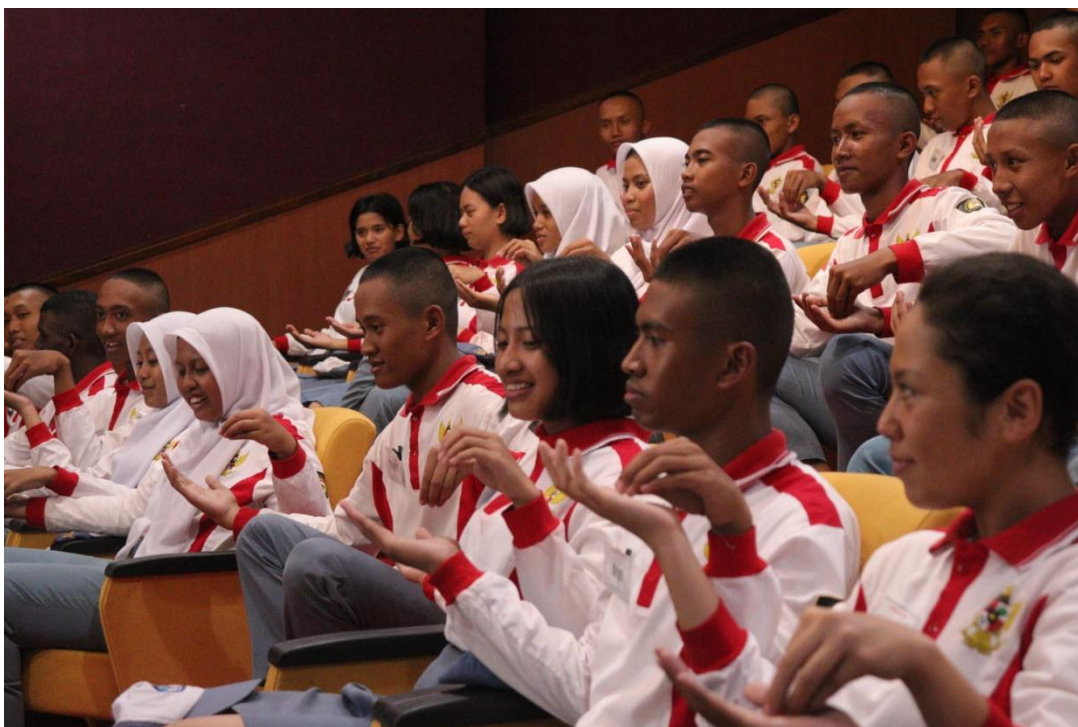
Gambar 1. Peserta Kegiatan

Kegiatan ini diikuti oleh 80 Anggota Pasukan Pengibar Bendera Pusaka Kota Salatiga sebanyak 80 Peserta yang terdiri dari Generasi Z usia 15 – 17 Tahun. Dokumentasi Peserta Kegiatan dapat dilihat pada Gambar 1 .