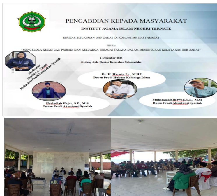
Gambar 5. edukasi pengelolaan keuangan dan kelayakan zakat