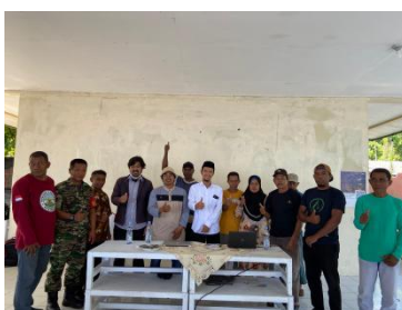
Gambar 3. Foto bersama dengan peserta PKM

Tujuan utama dari kegiatan ini, untuk mengamalkan di dharma perguruan tinggi (pendidikan, penelitian dan pengabdian kepada masyarakat) yaitu pengabdian kepada masyarakat yang merupakan salah satu dari kewajiban bagi sivitas akademika. Sehingga, tujuan terselenggaranya kegiatan pengabdian kepada masyarakat ini untuk memberikan pelatihan dan pemahaman tentang pengelolaan keuangan, serta kelayakan zakat. Kegiatan ini melibatkan para peserta dari masyarakat sekitar yang ada pada wilayah kesultanan Ternate Kelurahan Sulamadaha. Dalam kegiatan ini dihadiri oleh masyarakat sekitar sebanyak 36 peserta pelatihan yang aktif terlibat dalam kegiatan ini. Melalui partisipasi mereka, diharapkan bahwa kegiatan ini dapat memberikan dampak positif dan memberdayakan masyarakat yang dilibatkan. Gambar 3 adalah tampilan dari para perwakilan yang terlibat pada pelaksanaan kegiatan pengabdian kepada masyarakat.