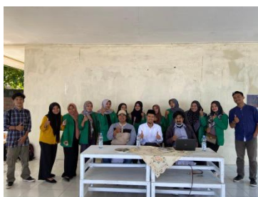
Gambar 2. Tim pelaksana kegiatan pengabdian kepada masyarakat

Jumat 01 Desember 2023 telah diadakan dan terlaksana dengan sukses kegiatan pengabdian kepada masyarakat yang diadakan oleh kalaborasi antara mahasiswa dan dosen IAIN Ternate di Kota Ternate Kelurahan Sulamadaha. Gambar 2 adalah tampilan tim pelaksana kegiatan pengabdian kepada masyarakat.