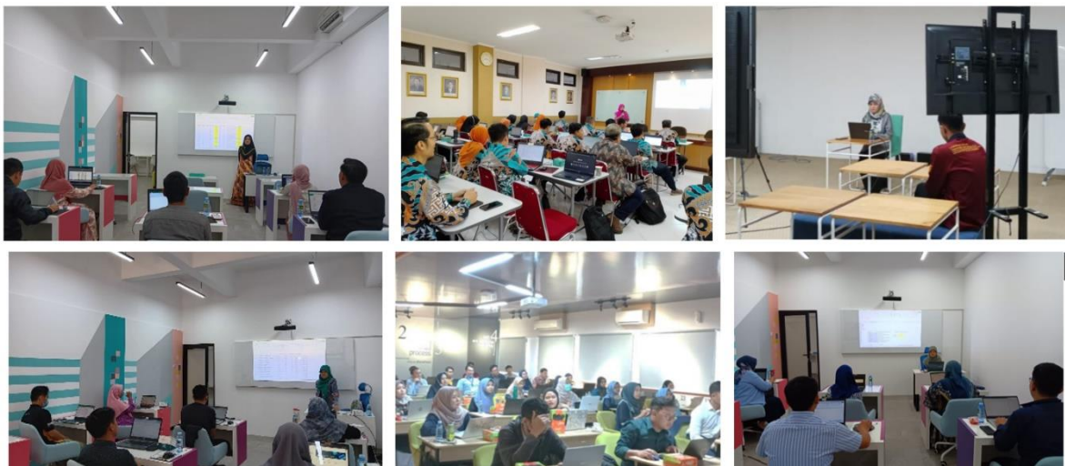
Gambar 2. Kegiatan pelatihan.

Pelatihan telah dilakukan dan berjalan dengan lancar. Gambar 2 menunjukkan kegiatan pelatihan yang telah dilakukan.