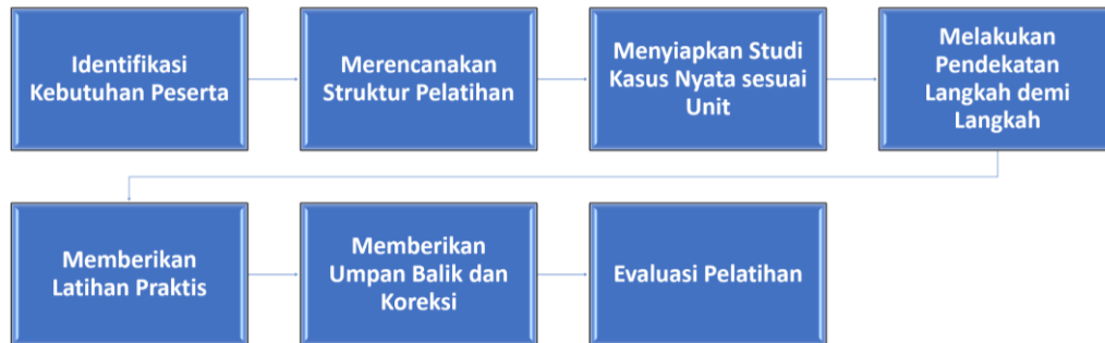
Gambar 1. Tahapan pelatihan.