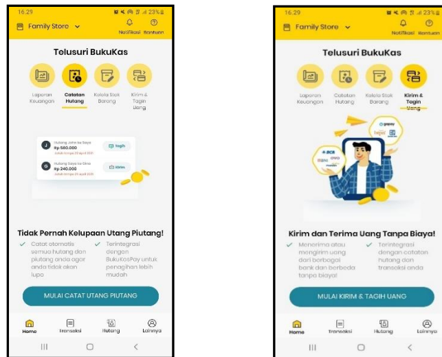
Gambar 4. Isi Aplikasi Buku Kas