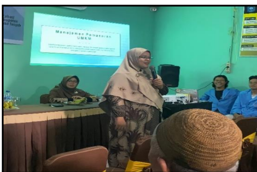
Gambar 2. Penyampaian Materi Manajemen UMKM

Pelatihan manajemen dalam kegiatan pengabdian masyarakat ini memberikan ceramah tentang manajemen bisnis dan keuangan. Materi disampaikan oleh narasumber dari Universitas Bangka Belitung. Pelatihan ini bertujuan untuk memberikan pemahaman bagi peserta terkait dengan pengelolaan usaha hingga pengelolaan keuangan.