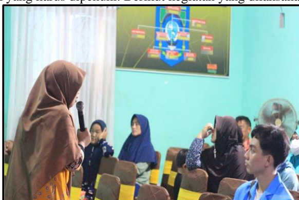
Gambar 3. Narasumber 1 menyampaikan materi

Pelatihan akuntansi melibatkan narasumber dari Universitas Bangka Belitung, dosen akuntansi. Pelatihan dilaksanakan dengan metode ceramah yakni melakukan transfer knowledge dengan media powerpoint. Tujuannya agar pemilik mencatat modal awal, pengeluaran atau pembelian. Penjualan atau pemasukan, utang dan piutang. Dengan demikian peserta pelatihan mengetahui bahwa berapa modal awal yang kita investasikan, berapa jumlah uang yang dikeluarkan, berapa jumlah penjualan dan utang piutang yang menjadi kewajiban dan hak yang harus dipenuhi. Berikut kegiatan yang dilaksanakan: