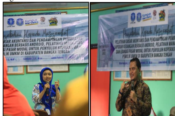
Gambar 5. Edukasi dari BEI dan IPOT

Saat ini UKM menjadi sektor yang paling mengalami keterpurukan dan paling banyak menerima dukungan dari pemerintah, antara lain BLT UKM, keringanan kredit, keringanan pajak, dan lain-lain demi membantu UMKM [18]. Oleh karena itu, dibutuhkan sosialisasi dan edukasi agar UMKM memiliki wawasan pengelolaan modal dengan investasi dan juga akses modal dengan melakukan Initial Public Offering (IPO) di pasar modal melalui program ‘Yuk Nabung Saham’ dan Reksadana menjadi alternatif. Fintech Crowdfunding juga dapat dijadikan alternatif pembiayaan. Kegiatan ini disampaikan oleh Kepala PT. BEI Wilayah Bangka Belitung dan Manager Cabang PT. IPOT.