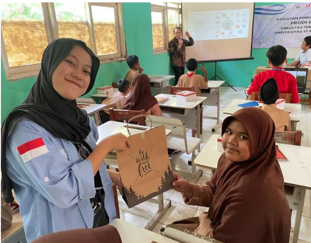
Gambar 8. Pemberian hadiah bagi peserta yang Aktif