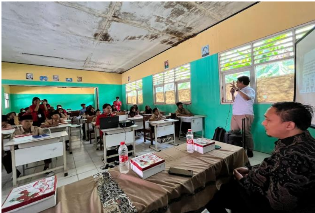
Gambar 5. Pemaparan materi dari Narasumber