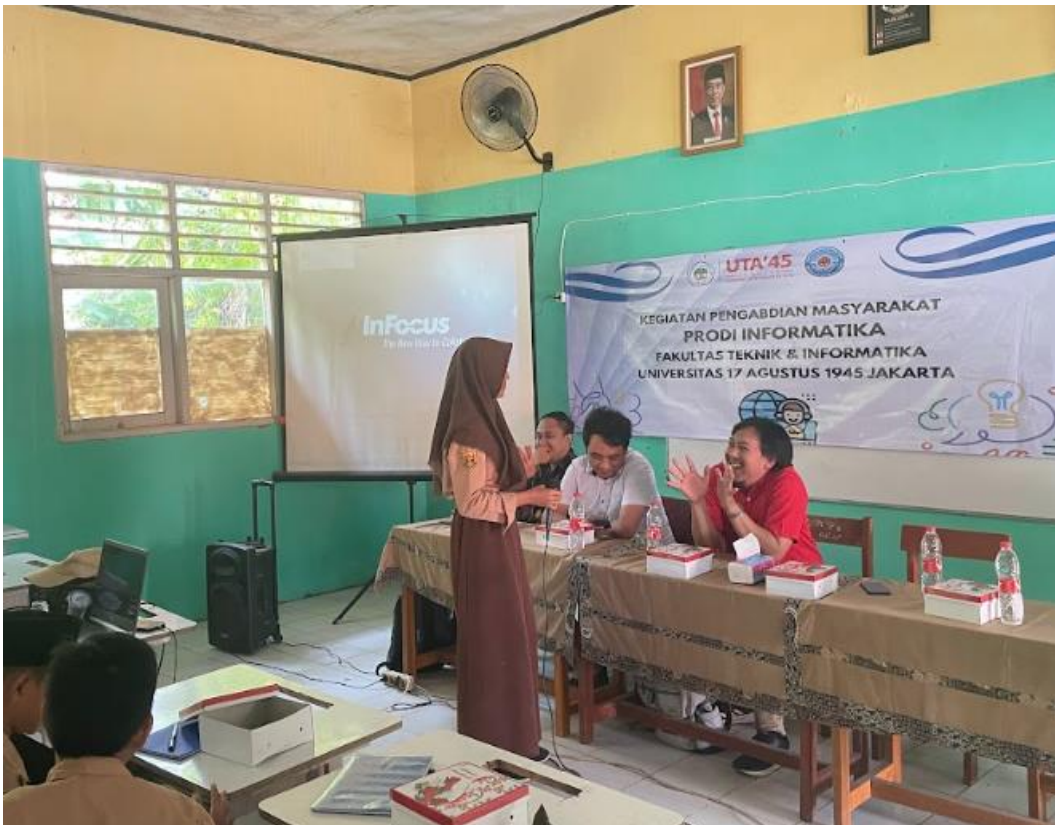
Gambar 9. Peserta bertanya kepada Narasumber