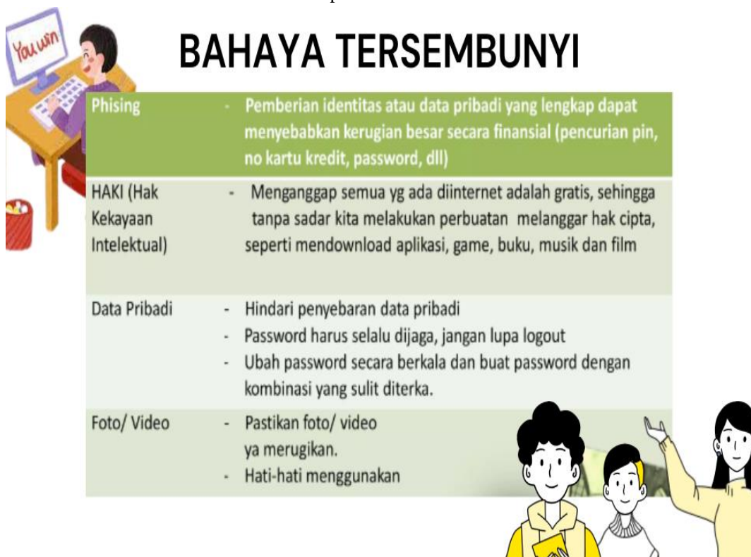
Gambar 6. Salah satu materi yang disampaikan Narasumber