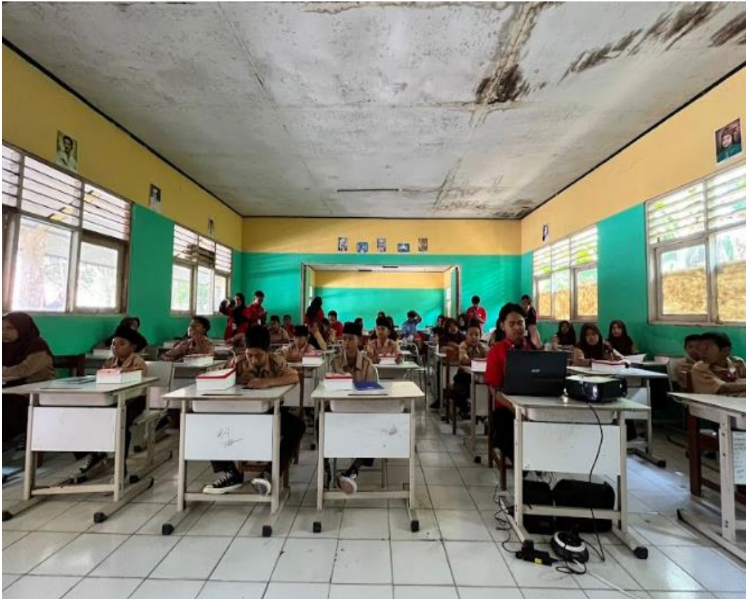
Gambar 7. Respon Peserta dalam mendengarkan Pemaparan Narasumber