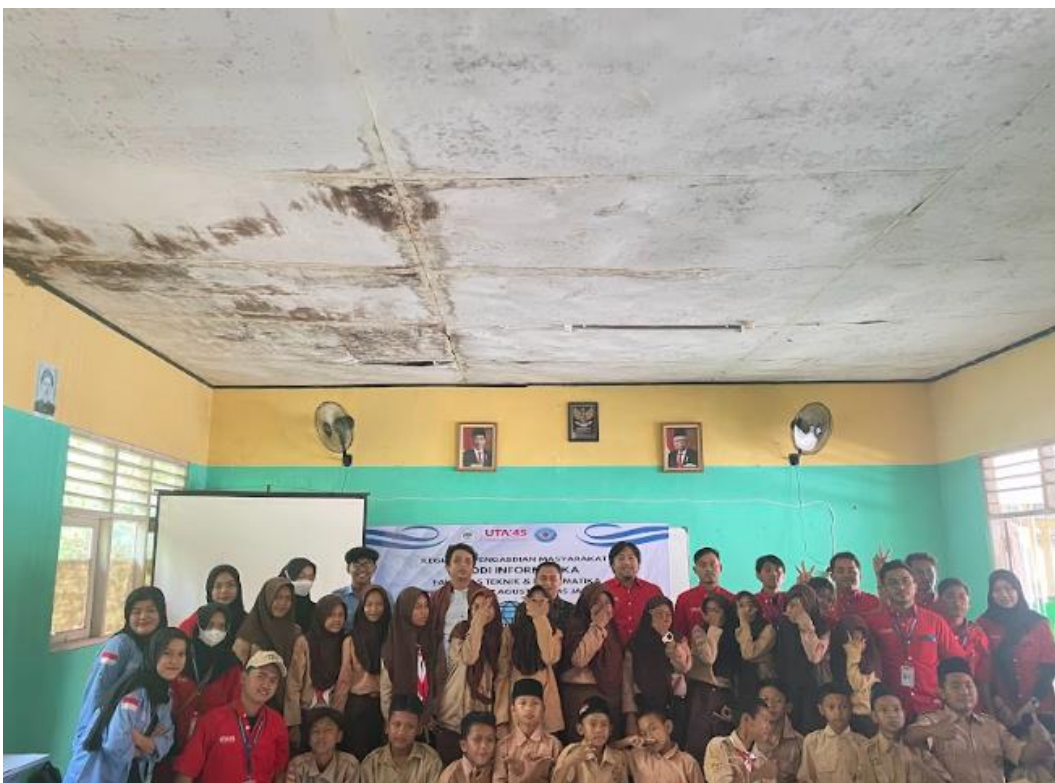
Gambar 10. Foto bersama berakhirnya kegiatan

Selesai kegiatan pengabdian, dilakukan post-test untuk mengetahui sejauh mana pemahaman yang didapatkan oleh siswa, serta ketertarikan terkait pelatihan penggunaan internet sehat yang lebih dalam terlihat pada Tabel 2.