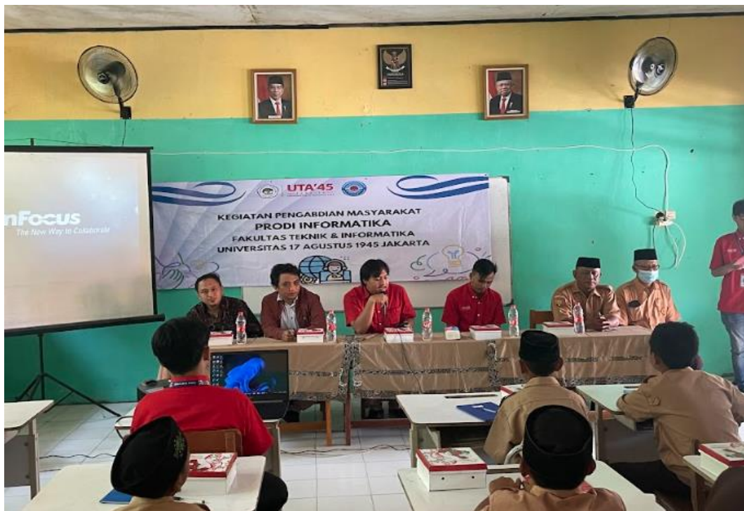
Gambar 4. Sambutan Dosen Kepala Prodi Informatika Universitas 17 Agustus 1945 Jakarta di SMP N 2 Muara Gembong.

Sebelum masuk keranah inti kegiatan, tim memberikan pre-test terkait pengetahuan penggunaan internet sehat yang terlihat pada Tabel 1 .