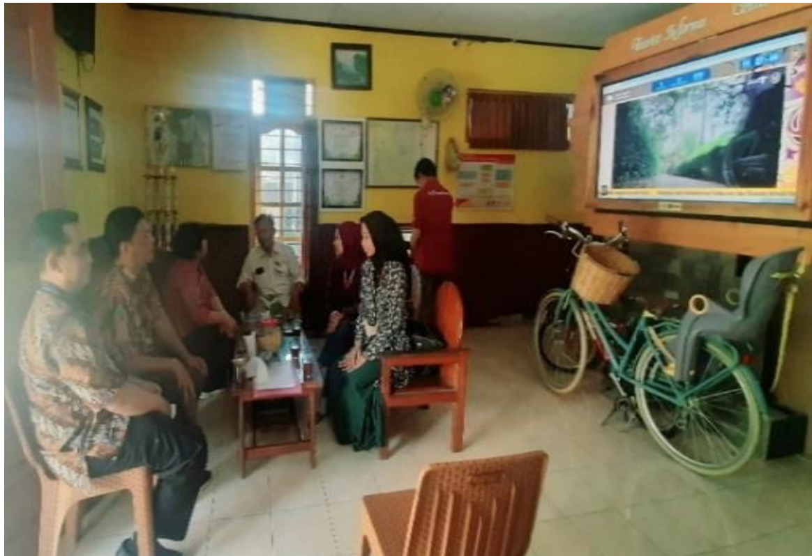
Gambar 3. Kajian Awal Melalui Diskusi Informal