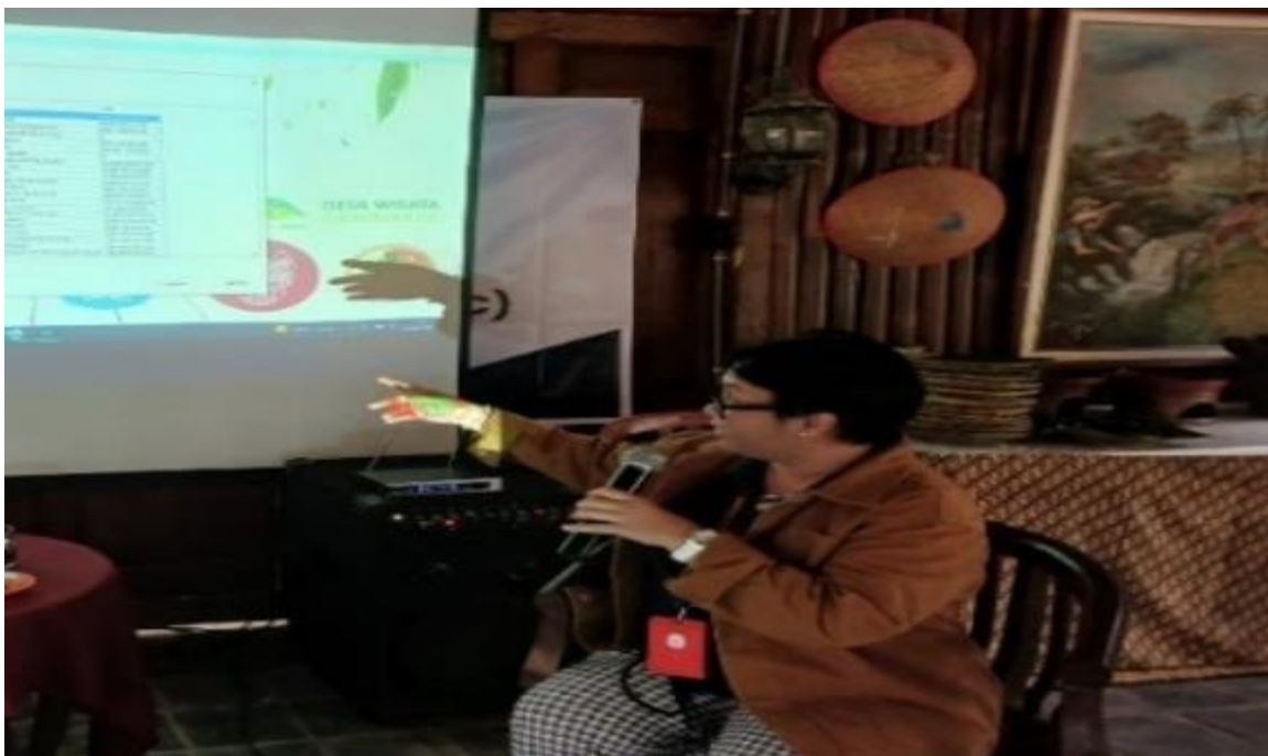
Gambar 4. Kegiatan Workshop

Ketika sembilan elemen-elemen BMC dikaitkan dengan hasil diskusi mendalam dan praktik memahami kondisi desa wisata Candirejo, maka didapatkan hasil pemahaman bersama dan disepakati, seperti tampak pada Tabel 1 , Tabel 2 dan Tabel 3 . Mitra utama adalah warga masyarakat setempat, mitra di sektor pendidikan utamanya siswa sekolah dan pemerintah yang diharapkan mampu mendukung promosi dan infrastruktur wisata. Kegiatan utama yang dikelola adalah pengalaman budaya, ekowisata dan homestay . Sedangkan proposisi nilai yang menjadi daya unggul desa wisata Candirejo adalah pengalaman budaya mendalam, ekowisata berkelanjutan dan homestay unik karena menjadi satu kesatuan dengan pemilik rumah yaitu penduduk asli.