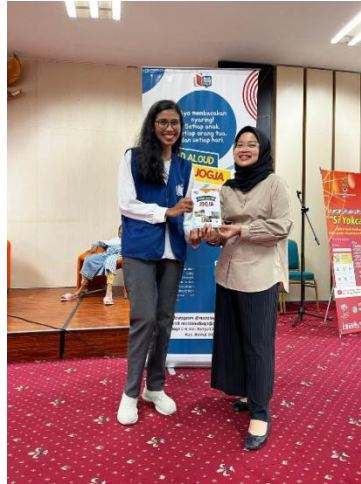
Gambar 5. Penyerahan Brosur dan Company Profile Komunitas Read Aloud Jogja

Kendala pelaksanaan pengabdian masyarakat ini yaitu pada pengumpulan data dan dokumentasi dari Komunitas Read Aloud Jogja. Tim pengabdian masyarakat meminta dokumentasi dari pengurus Komunitas Read Aloud Jogja, yang cukup banyak, dan melakukan pemilihan foto sesuai dengan kebutuhan untuk desain Company Profile dan Brosur Komunitas. Namun, hal tersebut masih dapat diatasi dengan kerjasama dengan pengurus untuk membantu melakukan pemilihan foto.