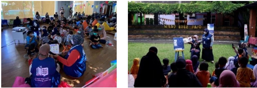
Gambar 1. Kegiatan Komunitas Read Aloud Jogja