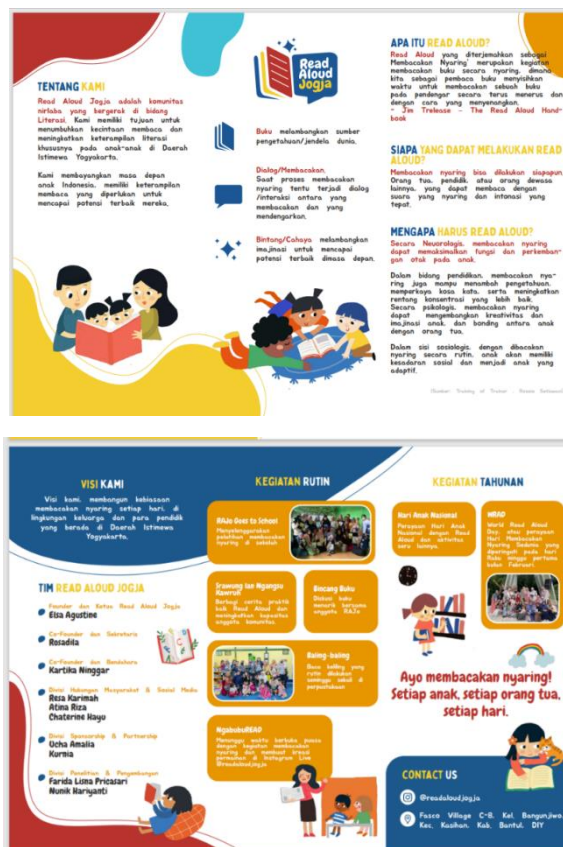
Gambar 3. Desain Brosur Komunitas Read Aloud Jogja

Keberadaan sebuah company profile adalah kewajiban bagi sebuah perusahaan, karena dalam company profile berisikan sebuah identitas perusahaan. Di dalam sebuah company profile sebaiknya dapat berisikan sebuah identitas, budaya perusahaan, informasi perusahaan sehingga mudah untuk diberikan kepada publik eksternal dalam bentuk company profile [10]. Company profile book dibuat dalam bentuk buku yang akan digunakan sebagai media resmi yang memberikan informasi lengkap dan jelas mengenai Komunitas Read Aloud Jogja. Adapun Company profile book komunitas dibuat dalam ukuran A5. Penentuan ukuran ini dengan pertimbangan lebih praktis dan memudahkan untuk dibawa serta dibagikan pada masyarakat. Company profile book komunitas Read Aloud Jogja terdiri dari 14 halaman yang memuat visi komunitas, jargon/ tagline, logo komunitas, gambaran umum komunitas, susunan organisasi, serta dokumentasi kegiatan komunitas. Brosur komunitas Read Aloud Jogja dapat dilihat pada Gambar 2.