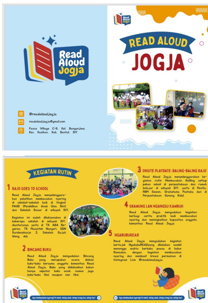
Gambar 2. Desain Brosur Komunitas Read Aloud Jogja

Pembuatan company profile book dan brosur komunitas Read Aloud Jogja dilakukan dengan 3 tahapan, yaitu tahap pra produksi, produksi dan pasca produksi. Pada tahap pra produksi, tim pengabdian masyarakat