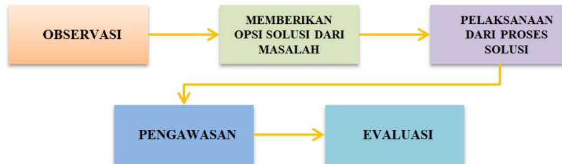
Gambar 1 Metode Pelaksanaan Kegiatan Pengabdian Kepada Masyarakat

Rencana kerja Pendampingan Kepada Masyarakat (PKM) tentang pendampingan strategi pemasaran digital menggunakan platform toko online di percetakan UFA Berkah telah berlangsung selama 2 bulan di tahun 2023. Kegiatan ini melibatkan pendampingan secara langsung kepada anggota masyarakat. Proses pendampingan ini mencakup berbagai pendekatan, mulai dari penyuluhan hingga penyelenggaraan pelatihan teknis khusus.