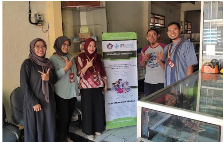
Gambar 8. Tampilan awal toko online www.ufaberkahcetak.com

efisien. Dengan mengikuti panduan ini, diharapkan percetakan UFA Berkah dapat menjaga kualitas layanan pelanggan mereka di platform media sosial dan menghasilkan pengalaman positif bagi calon konsumen.