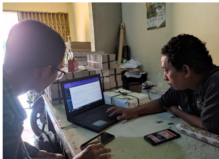
Gambar 6. Pelatihan dan pendampingan pengunggahan produk

Dengan menerapkan rekomendasi ini, diharapkan postingan foto dan video dari percetakan UFA Berkah akan memiliki jangkauan yang lebih luas dan memungkinkan mereka untuk menarik perhatian lebih banyak pengguna internet. Penggunaan pendekatan ini akan memberi peluang lebih besar bagi percetakan UFA Berkah untuk menjangkau calon pelanggan dan memperoleh interaksi yang lebih baik dengan audiens mereka di platform media sosial.