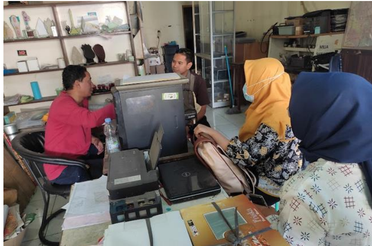
Gambar 2. Dokumentasi observasi tim pengabdian dengan mitra

Pada tahap ini, dijelaskan tentang penggunaan toko online dan prospek kedepannya, yang selain digunakan sebagai company profile , ternyata juga dapat dijadikan sarana publikasi produk dan untuk berjualan. Toko online dapat diakses melalui website dan aplikasi di perangkat seluler, sehingga penggunaannya menjadi lebih mudah. Dalam konteks ini, tim pengabdian pada kegiatan pendampingan memberikan penjelasan mengenai cara menggunakan toko online UFA Berkah baik melalui website maupun aplikasi di perangkat seluler pada alamat http://www.ufaberkahcetak.com .