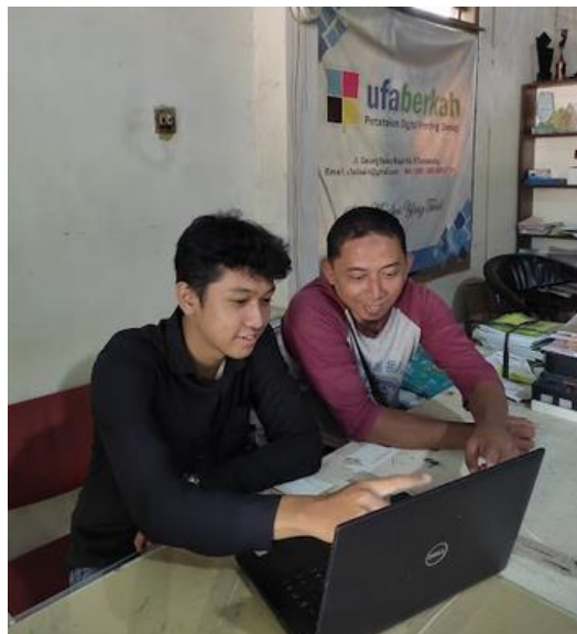
Gambar 3. Pelatihan menggunakan toko online www.ufaberkahcetak.com

Manajer pada percetakan UFA Berkah sudah memiliki pemahaman tentang toko online dan telah menggunakan platform tersebut pada usaha yang lainnya, sehingga tim pengabdian dapat dengan mudah menyampaikan materi penjelasan. Selain usaha percetakan yang sekarang dijadikan objek pengabdian itu, beliau juga sudah memiliki toko online dan bahkan telah menjual produknya. Produk yang dijual merupakan hasil dari jual beli sparepart komputer dan laptop dengan variasi yang beragam. Dalam dunia bisnis, baik secara langsung maupun online , risiko penipuan atau kecurangan tetap ada. Oleh karena itu, baik para penjual ( seller ) maupun pembeli ( buyer ) harus menjaga kewaspadaan, mengenai jenis-jenis penipuan dalam transaksi jual beli online , dan berhati-hati. Berikut adalah dokumentasi tentang kegiatan sosialisasi yang dilakukan oleh tim PKM terlihat pada Gambar 3.