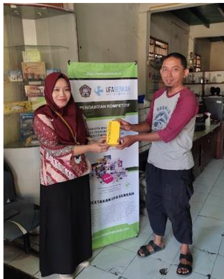
Gambar 9. Penyerahan bantuan media akses berupa smartphone

Hasil positif ini menunjukkan bahwa upaya pemanfaatan media digital dan strategi pemasaran melalui platform sosial media telah memberikan dampak nyata terhadap peningkatan penjualan percetakan UFA Berkah. Dengan peningkatan penjualan sebesar 2%, ini menegaskan bahwa investasi waktu dan usaha dalam memanfaatkan media digital telah memberikan hasil yang berarti. Langkah selanjutnya, dengan memberikan tanggung jawab pengelolaan akun toko online kepada manager percetakan UFA Berkah, diharapkan mereka dapat melanjutkan dan memperkuat strategi pemasaran melalui platform media sosial tersebut, serta memastikan kelangsungan pertumbuhan bisnis mereka dalam era digital yang terus berkembang.