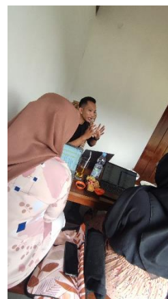
Gambar 10. FGD Optimalisasi Teknologi Digital