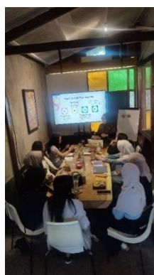
Gambar 6. Pelatihan Keterampilan Komunikasi Pertemuan 1

Berdasarkan rangkuman hasil skor mengenai keterampilan komunikasi dalam tabel di atas, secara keseluruhan terjadi peningkatan kemampuan rata-rata peserta sebesar 33% atau peningkatan jumlah skor rata-rata sebesar 32.