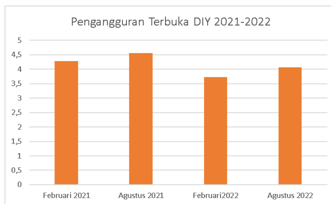
Gambar 1. Jumlah pengangguran terbuka DIY tahun 2021-2022 [1]

2022 di bulan Februari. Penurunan tersebut sebanyak 8,3 % dibanding data bulan Agustus 2021. Kenaikan angka pengangguran terbuka terjadi sebanyak 3,3% di bulan Agustus 2022.