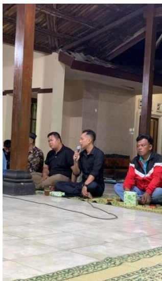
Gambar 3. Pelatihan Persiapan Karir Sesi 1

Pelatihan persiapan karir terdiri dari 5 materi utama yang dilaksanakan dalam 3 sesi (14 dapat dilihat pada Gambar 3, Gambar 4 dan Gambar 5). Tim PKM mengawali kegiatan dengan melakukan assessment dan/atau pre-test untuk mengetahui kemampuan awal peserta, selanjutnya tim memaparkan materi terkait wawasan persiapan kerja pada peserta, dan mengakhiri dengan post-test untuk mengetahui peningkatan kapasitas peserta setelah memperoleh materi. Uraian hasil pelaksanaan kegiatan menunjukkan skor rata-rata seluruh peserta yang disajikan dalam Tabel 3. Berdasarkan rangkuman hasil skor mengenai persiapan karir dalam tabel di atas, secara keseluruhan (20) terjadi peningkatan kemampuan rata-rata peserta sebesar 12% atau peningkatan jumlah skor rata-rata sebesar 30.