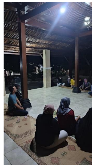
Gambar 5. Pelatihan Persiapan Karir Sesi 3