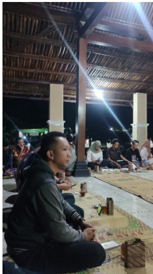
Gambar 4. Pelatihan Persiapan Karir Sesi 2