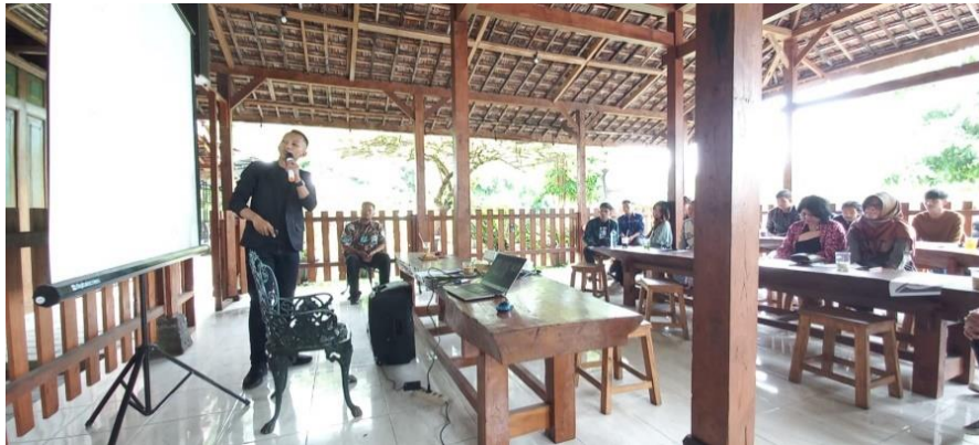
Gambar 7. Pelatihan Keterampilan Komunikasi Pertemuan 2