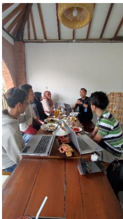
Gambar 8. FGD Optimalisasi Teknologi Digital

Berdasarkan rangkuman hasil skor mengenai optimalisasi teknologi digital dalam tabel di atas, secara keseluruhan terjadi peningkatan kemampuan rata-rata peserta sebesar 40% atau peningkatan jumlah skor rata-rata sebesar 32.