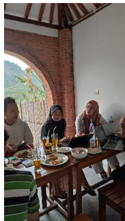
Gambar 9. FGD Optimalisasi Teknologi Digital