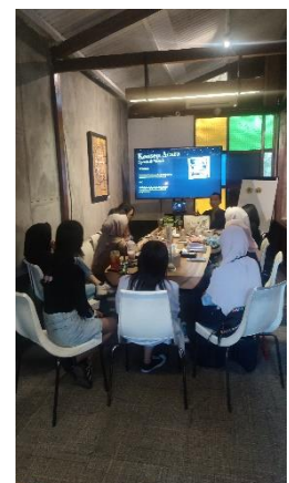
Gambar 11. FGD Optimalisasi Teknologi Digital