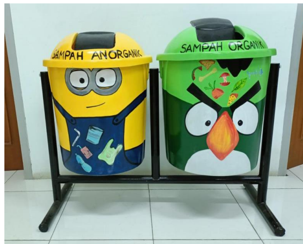
Gambar 4. Tempat sampah yang telah selesai didesain