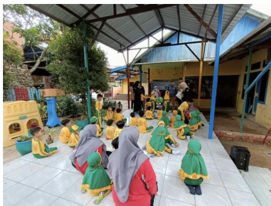
Gambar 5. Pemaparan Materi Pemilahan Sampah

Kegiatan sosialisasi dilaksanakan pada Hari Jumat, 21 Juli 2023 di TK ABA 10 Samarinda, Jalan Tri Darma, 24 Tempaja Selatan, Kecamatan Samarinda Utara, Kota Samarinda, Kalimantan Timur, 75243. Kegiatan ini diikuti oleh 47 orang siswa TK ABA 10 Samarinda dan 7 orang guru. Sosialisasi diawali dengan memberi pertanyaan kepada peserta didik terkait apakah pernah membuang sampah dan apakah pernah membuang sampah pada tempat sampah yang terpisah. Pada umumnya menjawab pernah membuang sampah namun tidak pernah membuang sampah pada tempat sampah terpisah. Sebelum pemberian materi dilakukan, peserta didik diminta membuang sampah sesuai jenisnya. Dari 10 peserta, hanya 1 peserta yang memahami cara membuang sampah sesuai jenisnya. Selanjutnya dilakukan penyampaian materi mengenai definisi sampah dan jenis-jenis sampah organik serta non organik seperti tersaji pada Gambar 5 . Setelah pemaparan materi dilanjutkan dengan latihan praktik membuang sampah sesuai dengan jenisnya seperti tersaji pada Gambar 6 . 37 Dari 10 peserta yang diminta untuk praktik, 6 peserta mampu membuang sampah dengan benar. Peserta terlihat sangat antusias menyimak materi yang disampaikan, begitu pula saat sesi praktik. Pada akhir acara, dilakukan penyerahan 33 tempat sampah dari tim pengabdian kepada pihak TK ABA 10 Samarinda. Adapun dokumentasi kegiatan dapat dilihat pada Gambar 7 .