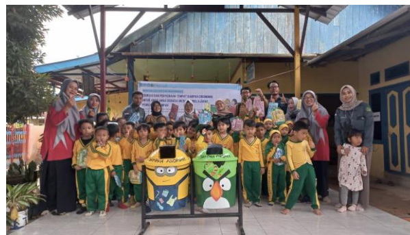
Gambar 7. Serah Terima Tempat Sampah ke Pihak Sekolah

Keberhasilan kegiatan pengabdian kepada masyarakat dapat diketahui melalui peningkatan pengetahuan siswa TK ABA 10 Samarinda mengenai jenis-jenis sampah. Hal ini ditandai dengan meningkatnya jumlah siswa TK ABA 10 Samarinda yang mengetahui perbedaan sampah organik dan anorganik. Berdasarkan hasil evaluasi, kesadaran dan pemahaman para siswa mengalami peningkatan menjadi 60% dari yang sebelumnya hanya 10% siswa yang sadar dan paham mengenai cara memilah sampah secara tepat dari sumbernya. Hal ini dihitung dari peningkatan jumlah peserta yang dapat membuang sampah sesuai jenisnya dengan benar saat sebelum dan setelah sosialisasi. Adapun kendala pelaksanaan kegiatan pengabdian kepada masyarakat ini adalah sulitnya menciptakan situasi yang kondusif pada saat pemaparan materi dikarenakan peserta masih anak-anak usia 4 – 6 tahun. Untuk mengatasi kendala ini beberapa kali tim kegiatan meminta siswa agar tetap diam dan duduk, dengan mengajak mereka tepuk diam dan memberi hadiah untuk siswa yang kooperatif. Kerja sama dengan tim pengajar di TK ABA 10 juga berperan penting dalam kelancaran proses sosialisasi. Para pengajar ikut membantu mengkondisikan siswa, terlebih pada siswa yang sangat aktif.