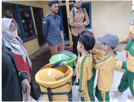
Gambar 6. Praktik Latihan Memilah Sampah