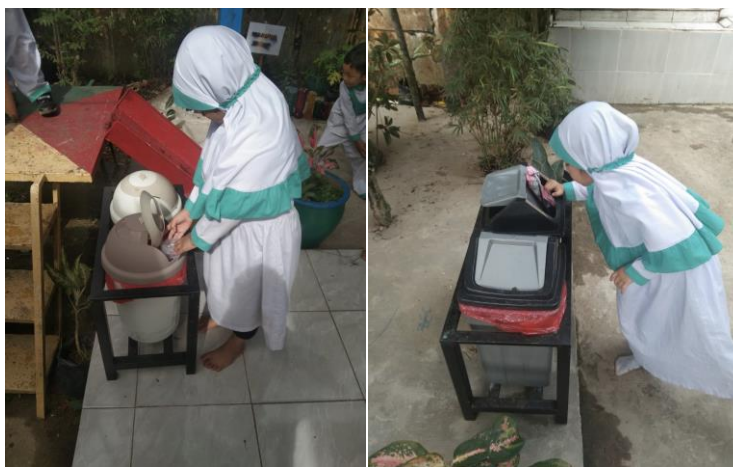
Gambar 1. Postur Tidak Ergonomis saat Anak Membuang Sampah

Terdapat beberapa parameter yang perlu diperhatikan terkait desain tempat sampah yaitu desain menarik, mudah digunakan, ukuran yang memadai, kuat/tahan lama, dan informatif [10]. Akan tetapi, pada TK Aisyiyah Bustanul Athfal (ABA) 10 Samarinda, terdapat sejumlah permasalahan berkaitan dengan penggunaan tempat sampahnya. Permasalahan pertama yang ditemui ialah berkaitan dengan ukuran dari sejumlah tempat sampah yang terlalu rendah. Terkadang, anak-anak harus menyesuaikan diri dengan membungkuk pada saat membuang sampah seperti disajikan pada Gambar 1. Hal ini tentu saja dapat menimbulkan rasa tidaknyamanan pada penggunanya dan berpotensi menyebabkan keluhan nyeri di beberapa segmen tubuh ( Musculoskeletal disorders/MSDs ) dikarenakan postur tubuh yang kurang baik. Dampak yang dapat ditimbulkan oleh MSDs terhadap anak ialah anak-anak menjadi cepat lelah, dengan adanya potensi kecacatan jika MSDs terjadi terus-menerus [11].