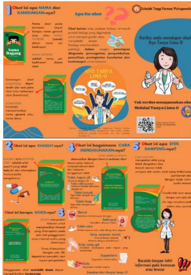
Gambar 2. Leaflet promosi kesehatan