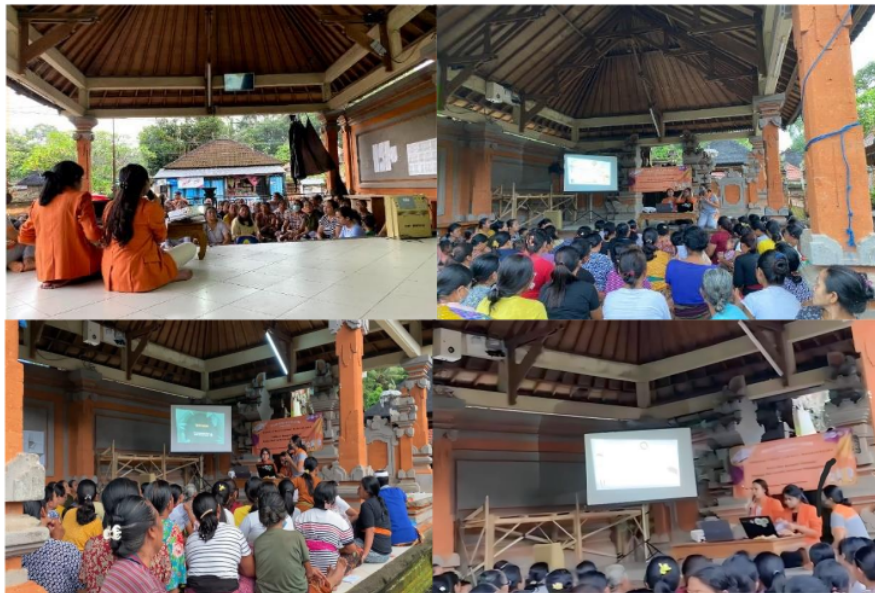
Gambar 4. Sesi penyampaian materi

Setelah sesi tanya jawab dan diskusi berakhir, para responden dievaluasi pemahamannya kembali melalui pengisian kuesioner akhir berupa posttest yang hasilnya dibandingkan dengan hasil pretest sebelumnya untuk melihat ada atau tidaknya peningkatan pemahaman responden setelah dilakukan promosi kesehatan. Berdasarkan kedua test yang dilakukan maka diperoleh nilai total dari 10 pertanyaan yang diajukan setiap test -nya. Nilai-nilai tersebut kemudian diuji secara statistik untuk melihat distribusi data hasil test menggunakan Kolmogorov-Smirnov kemudian dilanjutkan dengan nonparametric test menggunakan Two related sample test dengan tipe Wilcoxon .