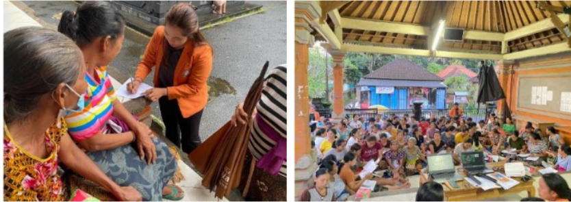
Gambar 3. Pengisian kuesioner awal (pretest)