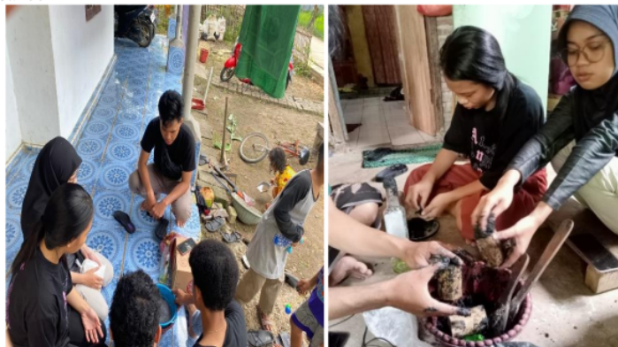
Gambar 3. Persiapan alat dan percobaan pembuatan briket