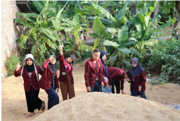
Gambar 2. Pencarian limbah sekam padi