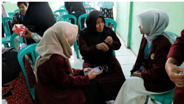
Gambar 4. Evaluasi kegiatan sosialisasi

Dalam pelaksanaan acara seminar inovasi pengolahan potensi lokal, tujuan yang diharapkan adalah peningkatan pemahaman tentang kewirausahaan dan pembuatan briket. Seminar ini ditujukan untuk perwakilan dari setiap RT dengan harapan mereka dapat membagikan pengetahuan yang diperoleh kepada warga mereka. Meskipun kegiatan ini menargetkan 30 peserta, hanya sekitar 15 orang yang menghadiri, karena kebanyakan warga Desa Panenjoan yang merupakan petani, bekerja dari pagi hingga malam hari. 15 peserta yang hadir memiliki profesi dan usia yang berbeda, untuk memastikan variasi dalam distribusi kuesioner.