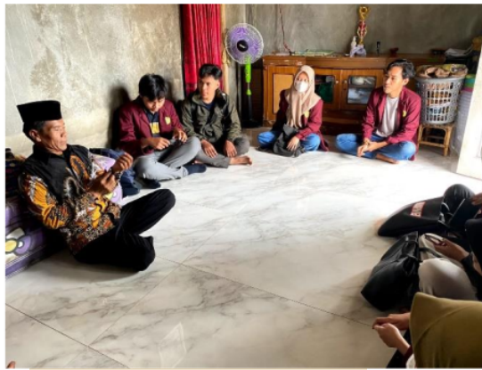
Gambar 1. Koordinasi dengan Kepala Desa Panenjoan

Wawancara dengan kepala desa untuk menggali informasi terkait potensi lokal yang ada di desa panenjoan ditunjukkan pada Gambar 1.