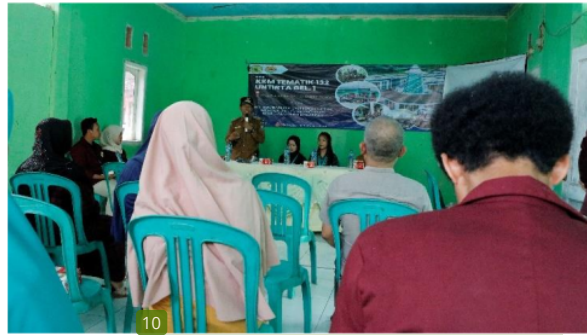
Gambar 4. Pembukaan acara secara resmi oleh Kepala Desa

Gambar 4 menunjukkan pembukaan acara secara resmi oleh kepala desa yang didampingi oleh kedua pemateri. Selanjutnya penyampaian materi, materi pertama disampaikan oleh Nandia Miftahul Aphdal bertujuan untuk meningkatkan pengetahuan atau wawasan peserta tentang briket dan cara pengolahan briket dari limbah sekam padi. Pada sesi pertama tersebut juga di presentasikan pembuatan sampel terhadap contoh produk pengolahan limbah padi kepada peserta seminar dengan menerapkan briket sebagai produk akhir. Materi kedua disampaikan oleh Astina Tinus bertujuan untuk meningkatkan pemahaman dan wawasan tentang kegiatan berwirausaha dengan memanfaatkan potensi lokal desa. Proses penyampaian materi ditunjukkan pada Gambar 5.