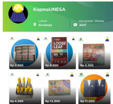
Gambar 3. Proses unggah foto produk Kopma Unesa

Langkah selanjutnya adalah simulasi pengelolaan dana yang masuk ke akun koperasi mahasiswa Unesa. Pesanan yang masuk dan telah dikirimkan ke ekspedisi harus muncul nomor resinya di laman pesanan yang telah dikirimkan. Peserta melakukan simulasi sinkronisasi pengiriman agar resi pesanan masuk secara otomatis sehingga dapat ter- update secara otomatis juga melalui status pengiriman. Penjual dan pembeli sama – sama dapat memantau status atau lokasi keberadaan pesanan saat ini sehingga juga dapat memantau dana yang masuk agar tidak terlalu lama mengendap di sistem. Setelah status barang telah diterima oleh konsumen maka dana akan langsung masuk ke saldo penjual. Peserta melakukan simulasi penarikan dana pada saldo pembelian. Dana yang ditarik akan diproses oleh sistem dan masuk ke rekening bank yang telah didaftarkan pada akun toko pada market place .