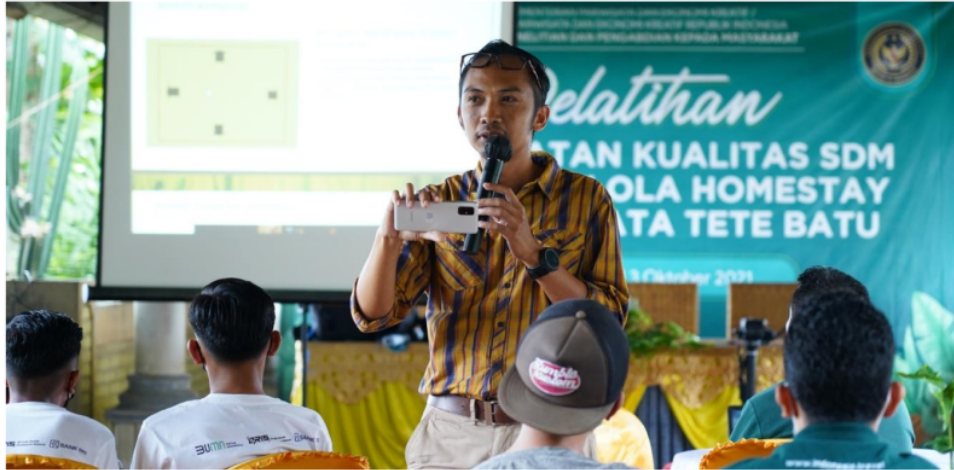
Gambar 4 Penyampaian materi pelatihan oleh narasumber sebelum peserta melakukan praktik lapangan di Wisma Soedjono Desa Tetebatu

Politeknik Pariwisata Lombok hadir untuk melaksanakan Tri Dhama Perguruan Tinggi dalam bentuk peningkatan kapasitas sumber daya manusia di Desa Tetebatu. Bentuk kegiatan yang dilaksanakan adalah pelatihan pengetahuan dasar fotografi sebagai kompetensi tambahan seorang pramuwisata [15]. Pelatihan yang dilaksanakan menggunakan pendekatan penyajian materi dan praktik langsung dilapangan yang diikuti oleh 40 peserta dengan kriteria aktif sebagai pramuwisata di Desa Tetebatu. Materi pelatihan yang diberikan meliputi; Fotografi dengan handphone , fitur kamera pada handphone ( optical zoom , aspek ratio , focusing , timer ). Pencahayaan (tipe cahaya, sumber cahaya), Komposisi ( camera shoot , sudut kamera), dan mengontrol obyek kamera (obyek diam, obyek bergerak).