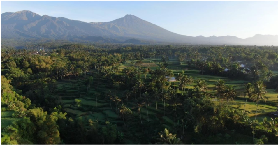
Gambar 2 Potensi pariwisata Desa Tetebatu yang menawarkan iklim yang sejuk dan pemandangan alam yang masih alami.