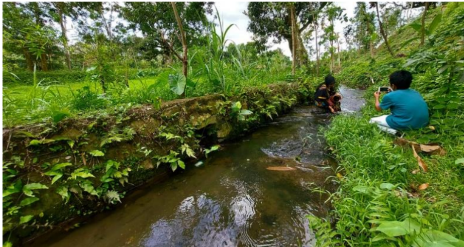
Gambar 5 Praktik dasar-dasar fotografi dengan obyek model sebagai wisatawan mengenakan pakaian adat Suku Sasak supaya wisatawan mendapat kesan positif dengan pakaian tersebut