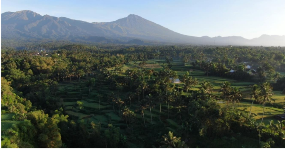
Gambar 2 Potensi pariwisata Desa Tetebatu yang menawarkan iklim yang sejuk dan pemandangan alam yang masih alami.

malaria, lepra, dan kusta yang ditugaskan oleh Pemerintah Hindia Belanda di Kabupaten Lombok Timur. Raden Soedjono juga orang perta yang mendirikan wisma (Wisma Soedjono) untuk tempat peristirahatan sekaligus tempat menginap orang-orang Eropa sahabat Raden Soedjono pada masa itu. Seiring berjalannya waktu, wisma Wisma Soedjono semakin dikenal dan banyak orang yang berkunjung tidak hanya sahabat dan rekan sejawat Raden Soedjono tetapi juga wisatawan. Wisma Soedjono telah mendorong perkembangan usaha-usaha akomodasi lainnya di sekitar Desa Tetebatu sehingga berkembang menjadi salah satu desa wisata populer di Lombok Timur [14].