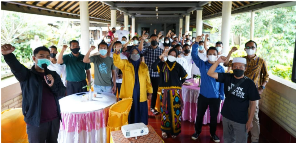
Gambar 7 Foto bersama peserta pelatihan fotografi dasar pramuwisata Desa Tetebatu