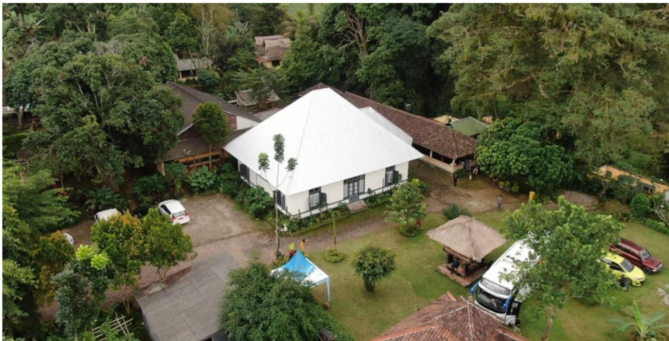
Gambar 3 Wisma Soedjono adalah pelopor Homestay di Desa Tetebatu yang berdiri sejak tahun 1925

Berkembangnya pariwisata pedesaan di Desa Tetebatu hingga masuk sebagai nominasi mewakili Indonesia dalam kategori Best Tourism Village yang digelar oleh organisasi pariwisata dunia PBB (UNWTO) 2022. Desa Tetebatu terletak di Kecamatan Sikur Kabupaten Lombok Timur ini lebih berfokus pada aktifitas wisata sejarah selain juga memiliki keindahan alam yang memiliki daya tarik tersendiri. Desa Tetebatu juga terdapat banyak homestay sebagai fasilitas akomodasi wisatawan yang berkunjung. Rekam jejak desa tetebatu dalam perkembangan pariwisata Indonesia menjadi rujukan Politeknik Pariwisata Lombok untuk turut andil dalam pengembangan desa-desa wisata di Lombok khususnya Desa Tetebatu.