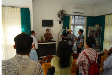
Gambar 4. Demonstrasi Check in dan Check out

Pada materi check out dipaparkan mengenai proses dan prosedur check out . proses check out merupakan bagian yang tak terpisahkan dalam pengelolaan kantor depan. Dalam proses dan prosedur check out bertujuan untuk memastikan pembayaran kamar [15] telah di laksanakan dan memastikan kondisi kamar tidak ada yang terbawa oleh tamu atau kondisi rusak. Pada materi ini narasumber kepada peserta menjelaskan prosedur yang bisa dilakukan dalam menjalankan proses check out pada tamu sebagai berikut: