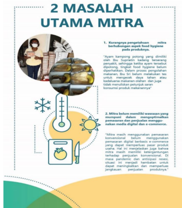
Gambar 2. Masalah Utama Mitra

Analisis situasi di atas menjelaskan bahwa pada masa pandemi Covid-19 diperlukan langkah antisipatif dalam menghadapi resesi global terutama bagi pelaku usaha catering untuk menguatkan dan meningkatkan nilai jual usahanya. Mitra UMKM dalam PKM kali ini adalah pelaku usaha kuliner catering skala mikro yang dikelola oleh kelompok kecil. Pemilihan UMKM ini dilatarbelakangi oleh beberapa pertimbangan, yaitu jenis usaha ini dipandang memiliki ketahanan usaha di masa pandemi dan resesi bila dikelola dengan baik dan memiliki nilai jual. Pemasaran digital dalam komunikasi pemasaran mampu memberikan kontribusi manfaat yang aplikatif dalam menjawab permasalahan dan kebutuhan mitra dalam mengembangkan usaha catering mereka.