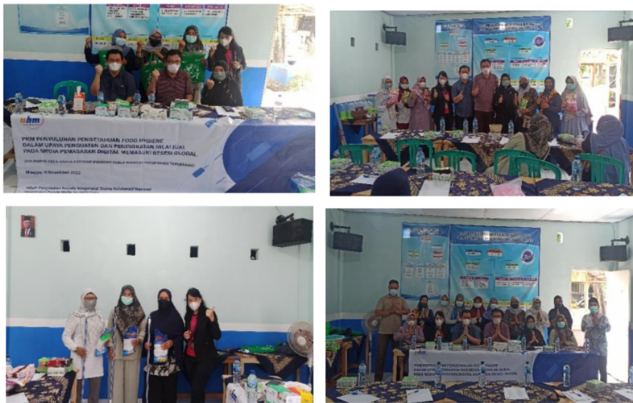
Gambar 10. Sesi penutup

Acara dilanjutkan dengan sesi praktek/pelatihan dan tanya jawab dimana setiap peserta akan mempraktekkan materi pelatihan mengenai digital marketing secara langsung. Ada panduan yang diberikan berisi urutan panduan setahap demi setahap cara pembuatan akun di e-commerce Shopee untuk dipraktekkan oleh Ibu-ibu pelaku usaha catering. Pertanyaan seputar pemasaran secara digital juga ditanyakan oleh pelaku bisnis catering agar dapat mereka terapkan dalam usaha mereka sehari-hari