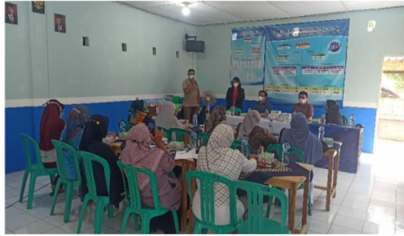
Gambar 5. Kata Sambutan Ketua RT05