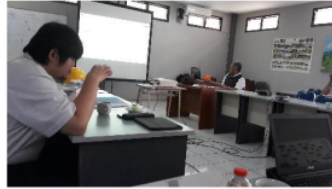
Gambar 10. Disseminasi hasil Studi lapangan potensi PLTMH dengan kunjungan lokasi

memperoleh data baik dari pengamatan, pengukuran, pendataan dan wawancara saat di lokasi menjadi pengalaman yang tidak terlupakan dan dapat di disseminasi ke masyarakat luas.