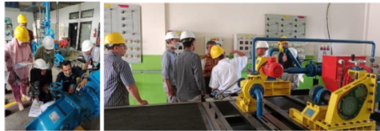
Gambar 6. Simulasi pengujian performa turbin

Selanjutnya peserta kembali diberikan tugas proyek dibagi dalam bentuk kelompok yang terdiri dari 2 (dua) kelompok untuk melaksanakan praktikum pengujian performa unit simulator turbin. Pengujian performa di gunakan 2 (dua) unit simulator turbin, antara lain turbin unit simulator turbin cross flow dan unit simulator turbin pelton mini. Masing-masing kelompok didampingi instruktur dan teknisi dalam proses praktikum pengujian performa sesuai formulir yang diberikan, dengan diberikannya tugas proyek ini bertujuan meningkatkan kapasitas peserta pelatihan mengetahui dan menganalisis performa dari unit simulator turbin.