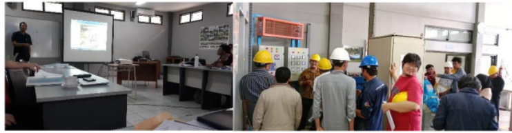
Gambar 4. Penyampaian passport dan tinjauan ke unit simulator turbin di laboratorium

Pelaksanaan kegiatan pelatihan hari kedua tanggal 20 Desember 2022 di ruang kelas dan laboratorium hidro Hycom dengan agenda penyampaian materi hidrologi, pengukuran debit, head , perencanaan bangunan air dan praktikum pengujian performa unit simulator turbin. Pada penyampaian materi hidrologi disampaikan oleh partner dari pemateri pertama dari PT. Entec Indonesia. Materi disampaikan secara komprehensif tentang analisis hidrologi untuk menyusun kebutuhan perencanaan PLTMH . Materi berikutnya disampaikan terkait metode pengukuran debit secara langsung. Adapun metode yang tersedia diantaranya metode apung dengan pelampung, metode volumetric menggunakan wadah tampungan, metode salt dilution menggunakan media garam dan metode velocity dan metode kontinu menggunakan current meter . Pada materi head disampaikan bahwa jarak ukur yang di gunakan pada penggunaan turbin aksial head diukur dari tinggi muka air pada bak penenang hingga axis turbin, sedangkan untuk penggunaan turbin reaksi di ukur mulai dari tinggi muka air bak penenang hingga ke elevasi akhir draft tube . Pada materi perencanaan bangunan air disampaikan macam-macam bangunan air yang ada pada sistem PLTMH mulai dari, bendung atau bendungan, intake saluran pembawa, saluran pelimpah, bak penenang, bak penguras sedimen, pintu air , dan trash rack .