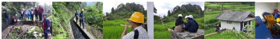
Gambar 8. Tinjauan lapangan di lokasi PLTMH

Pada hari ketiga tanggal 21 Desember 2022 peserta di bagi menjadi 2 (dua) kelompok dengan susunan acak, sesuai agenda dilaksanakan kegiatan tinjauan lapangan, kegiatan tinjauan lapangan pada lokasi PLTMH ini dilaksanakan dalam rangka memberikan pengalaman kepada peserta melakukan implementasi dari hasil penyampaian materi. Lokasi tinjauan lapangan berada di PLTMH Rimba Lestari, Desa Tangsi Jaya, Gunung Halu, Kabupaten Bandung Barat. Peserta diberikan 4 (empat) jenis formulir yang di saat berada di lokasi. Adapun 4 (empat) jenis formulir antara lain Formulir A informasi dasar potensi PLTMH , Formulir B informasi umum dan sosio ekonomi, Formulir C Informasi teknis bangunan air, head dan penstock , Formulir D Informasi teknis sistem mekanikal [16] dan elektrikal [17]. Kedua kelompok mengisi formulir identifikasi yang diberikan penyelenggara sesuai data lapangan baik hasil wawancara, pengukuran maupun spesifikasi yang tersedia di lapangan. Seluruh rangkaian pengambilan data ini bertujuan mengetahui potensi PLTMH yang ada membandingkan dengan unit pembangkit yang telah terbangun.