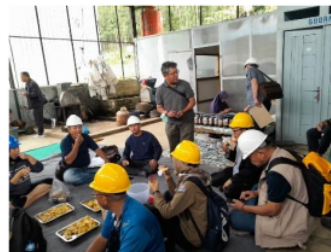
Gambar 9. Workshop Pengelolaan usaha masyarakat desa (rimba lestari)

Hasil dari tinjauan lapangan berdasarkan literasi terdahulu dan wawancara diketahui bahwa PLTMH yang dikelola oleh masyarakat Desa Tangsi Jaya, Gunung Halu, Kabupaten Bandung Barat berkapasitas 20 kW, sistem pembangkit mampu mendistribusikan energi listrik bagi penduduk sebanyak 80 rumah, dengan biaya retribusi listrik sebesar Rp. 25.000/bulan, dari 80 rumah, yang wajib membayar iuran pemanfaatan energi listrik sebanyak 70 rumah, sisanya merupakan rumah pengelola pembangkit dan bangunan fasilitas umum serta fasilitas umum penerangan. Mata pencaharian masyarakat di dominan oleh petani. Selain dari pengelolaan PLTMH masyarakat Desa Tangsi Jaya juga memperoleh bantuan dari Universitas Dharma Persada Jakarta berupa workshop dan peralatan mekanisasi hasil panen bagi petani kopi dengan fasilitas bangunan, rumah pengering, mesin pengolahan buah kopi [18]. Operator PLTMH Rimba Lestari telah berpengalaman mengoperasikan dan melakukan pemeliharaan sistem PLTMH karena telah di berikan pelatihan dari berbagai perguruan tinggi salah satunya dari Jurusan Teknik Energi, Politeknik Negeri Bandung [19].