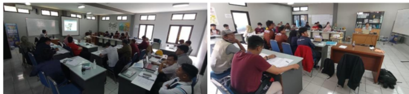
Gambar 5. Penyampaian materi hidrologi, pengukuran debit, head dan perencanaan bangunan air

Pelaksanaan kegiatan pelatihan hari kedua tanggal 20 Desember 2022 di ruang kelas dan laboratorium hidro Hycom dengan agenda penyampaian materi hidrologi, pengukuran debit, head , perencanaan bangunan air dan praktikum pengujian performa unit simulator turbin. Pada penyampaian materi hidrologi disampaikan oleh partner dari pemateri pertama dari PT. Entec Indonesia. Materi disampaikan secara komprehensif tentang analisis hidrologi untuk menyusun kebutuhan perencanaan PLTMH . Materi berikutnya disampaikan terkait metode pengukuran debit secara langsung. Adapun metode yang tersedia diantaranya metode apung dengan pelampung, metode volumetric menggunakan wadah tampungan, metode salt dilution menggunakan media garam dan metode velocity dan metode kontinu menggunakan current meter . Pada materi head disampaikan bahwa jarak ukur yang di gunakan pada penggunaan turbin aksial head diukur dari tinggi muka air pada bak penenang hingga axis turbin, sedangkan untuk penggunaan turbin reaksi di ukur mulai dari tinggi muka air bak penenang hingga ke elevasi akhir draft tube . Pada materi perencanaan bangunan air disampaikan macam-macam bangunan air yang ada pada sistem PLTMH mulai dari, bendung atau bendungan, intake saluran pembawa, saluran pelimpah, bak penenang, bak penguras sedimen, pintu air , dan trash rack .