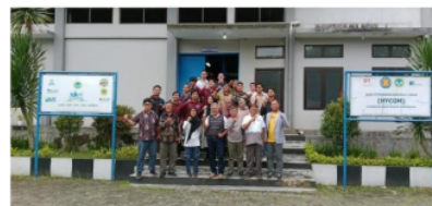
Gambar 12. Dokumentasi penyelenggara, pengajar dan peserta pelatihan