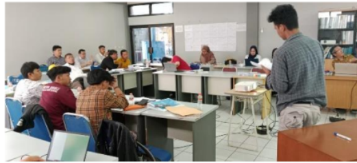
Gambar 7. Diseminasi hasil simulasi pengujian performa turbin

Pada hari ketiga tanggal 21 Desember 2022 peserta di bagi menjadi 2 (dua) kelompok dengan susunan acak, sesuai agenda dilaksanakan kegiatan tinjauan lapangan, kegiatan tinjauan lapangan pada lokasi PLTMH ini dilaksanakan dalam rangka memberikan pengalaman kepada peserta melakukan implementasi dari hasil penyampaian materi. Lokasi tinjauan lapangan berada di PLTMH Rimba Lestari, Desa Tangsi Jaya, Gunung Halu, Kabupaten Bandung Barat. Peserta diberikan 4 (empat) jenis formulir yang di saat berada di lokasi. Adapun 4 (empat) jenis formulir antara lain Formulir A informasi dasar potensi PLTMH , Formulir B informasi umum dan sosio ekonomi, Formulir C Informasi teknis bangunan air, head dan penstock , Formulir D Informasi teknis sistem mekanikal [16] dan elektrikal [17]. Kedua kelompok mengisi formulir identifikasi yang diberikan penyelenggara sesuai data lapangan baik hasil wawancara, pengukuran maupun spesifikasi yang tersedia di lapangan. Seluruh rangkaian pengambilan data ini bertujuan mengetahui potensi PLTMH yang ada membandingkan dengan unit pembangkit yang telah terbangun.