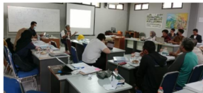
Gambar 11. Penyampaian materi penyusunan laporan feasibility studi perencanaan PLTMH

Selanjutnya pada pertemuan pelatihan di hari ke lima tanggal 23 Desember 2022 yang merupakan hari terakhir dilaksanakannya pelatihan, diisi kegiatan penyampaian materi penyusunan laporan perencanaan atau feasibility study untuk PLTMH . Adapun kerangka laporan yang akan dituangkan adalah terkait hidrologi, perencanaan bangunan air, perencanaan penstock , perencanaan mekanikal, perencanaan elektrik, estimasi biaya pembangunan, penjadwalan proyek, analisa ekonomi teknik dan analisa sosial budaya.