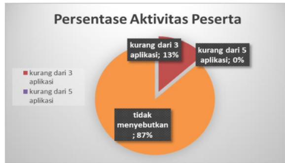
Gambar 3. Persentase Aktivitas Peserta

Berdasarkan hasil observasi dan wawancara terkait dengan kondisi pembelajaran di lokasi kegiatan, pengabdian memutuskan untuk melakukan kegiatan pelatihan menggunakan aplikasi Geogebra. Selanjutnya pengabdian menyusun materi pelatihan dengan menggunakan media power point seperti pada Gambar 4.