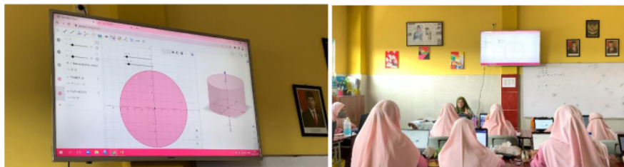
Gambar 7. Kegiatan praktik langsung menggunakan Geogebra

Kegiatan dilanjutkan dengan eksperimen peserta berupa praktik langsung menggunakan Geogebra untuk menyelesaikan permasalahan terkait luas permukaan dan volume tabung seperti pada Gambar 7. Selama proses eksperimen dilakukan juga kegiatan diskusi. Peserta terlihat antusias dalam mengikuti kegiatan pelatihan ini seperti nampak pada Gambar 8. Ada juga peserta yang menanyakan apakah aplikasi Geogebra ini tetap dapat digunakan untuk materi bangun ruang lain selain tabung? Peserta tertarik untuk menggunakan aplikasi Geogebra untuk materi bangun ruang lainnya selain tabung karena menurut mereka sulit untuk di gambar secara manual sehingga membutuhkan aplikasi seperti Geogebra ini.