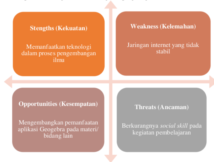
Gambar 2. Faktor-faktor yang dihasilkan

Hasil Kegiatan pelatihan pembuatan media pembelajaran menggunakan aplikasi Geogebra pada materi luas permukaan dan volume tabung ini diikuti oleh 30 peserta didik kelas IX SMP Putri Al Irsyad Al Islamiyyah Malang. Kegiatan ini dilaksanakan pada hari Selasa, 22 November 2022. Bentuk kegiatan yang dilakukan meliputi ceramah, diskusi, dan eksperimen. Secara umum keseluruhan kegiatan pelatihan ini berjalan dengan baik. Respon dari peserta pelatihan juga sangat baik. Hasil pelatihan pembuatan media pembelajaran menggunakan aplikasi Geogebra ini terdapat faktor-faktor penting seperti pada Gambar 2 berikut.