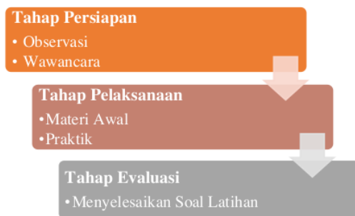
Gambar 1. Tahapan Pelaksanaan Pelatihan

Metode yang digunakan dalam pelatihan ini terdiri dari beberapa tahap yakni persiapan, pelaksanaan, dan evaluasi [12] yang disajikan dalam Gambar 1 berikut.