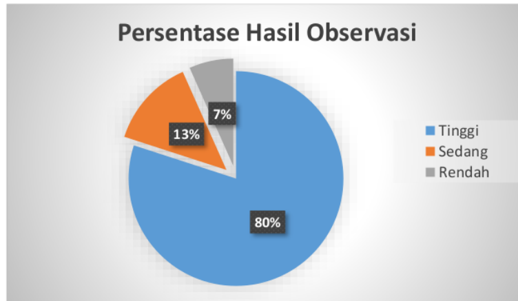
Gambar 9. Persentase data hasil observasi

Berdasarkan Gambar 9, capaian hasil yang diperoleh peserta menunjukkan angka 80% pada kategori tinggi. Peserta dapat menyelesaikan soal latihan yang diberikan dengan memanfaatkan geogebra sebagai alat bantu. Artinya sebagian besar peserta bisa mengoperasikan geogebra setelah dilakukan pelatihan. Untuk yang lainnya yakni 13% kategori sedang, dikarenakan mereka kehabisan waktu untuk melanjutkan menyelesaikan soalnya. Peserta dengan kategori rendah sebanyak 7%. Peserta tersebut tidak memperhatikan penuh ketika kegiatan pelatihan, sehingga banyak langkah pengoperasian yang masih tidak dapat dijalankannya. Selesai menyelesaikan soal evaluasi, peserta diberikan angket guna mengetahui respon peserta terhadap kegiatan pelatihan ini. Berikut bentuk angket yang digunakan seperti pada Tabel 2.