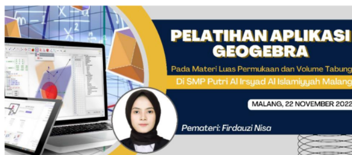
Gambar 4. Halaman awal materi pelatihan pada power point

Berdasarkan hasil observasi dan wawancara terkait dengan kondisi pembelajaran di lokasi kegiatan, pengabdian memutuskan untuk melakukan kegiatan pelatihan menggunakan aplikasi Geogebra. Selanjutnya pengabdian menyusun materi pelatihan dengan menggunakan media power point seperti pada Gambar 4.