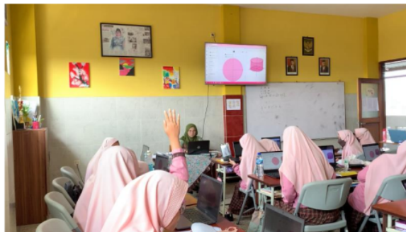
Gambar 8. Diskusi berupa tanya jawab dengan peserta