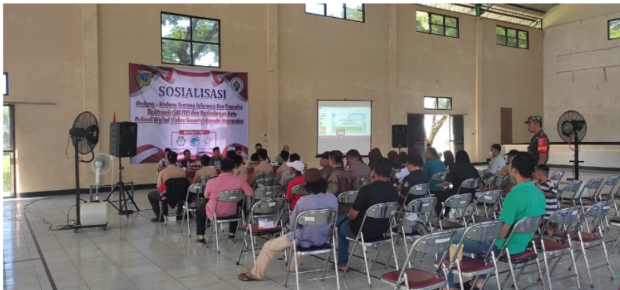
Gambar 3. Edukasi Tentang kejahatan Digital