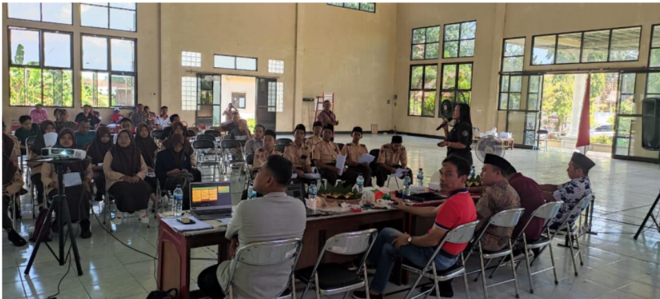
Gambar 4. Edukasi Aman dan Kreatif menggunakan Media Sosial