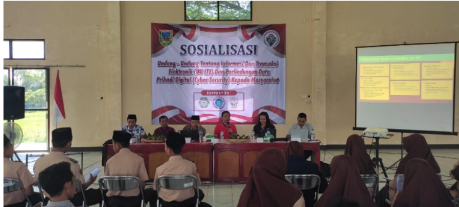
Gambar 2. Sambutan Kepala Kejaksaan Negeri Kudus