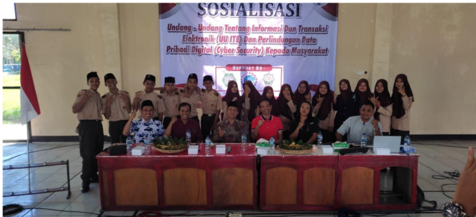
Gambar 6. Dokumentasi Kegiatan Pengabdian Kepada Masyarakat