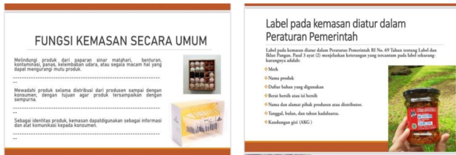
Gambar 3. Contoh materi yang disampaikan pada peserta tentang kemasan dan label usaha

Materi pada sesi ke-2 ini meliputi : manfaat kemasan dan labeling produk bagi produk dan bisnis kuliner yang dirintis ; pengetahuan tentang cara membedakan kemasan berdasarkan fungsi jenis dan bahannya; pemilihan kemasan berdasarkan unsur estetika dan perencanaan desain kemasan, pengetahuan tentang standar kemasan yang sesuai dengan produk; pengetahuan tentang cara dan peraturan labeling untuk produk, termasuk informasi apa saja yang tercantum dalam kemasan.; pengetahuan tentang berbagai persyaratan dan ketentuan tentang label, dimana kemasan berikut labelnya mengacu pada peraturan pemerintah. Pemaparan yang disampaikan narasumber, nampak pada Gambar 3.