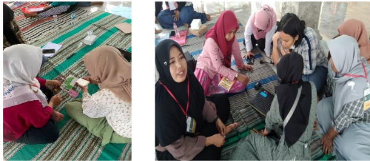
Gambar 4. Para peserta berdiskusi dengan tim pendamping tentang desain label usaha setelah pemberian edukasi tentang kemasan, logo dan labelling

makanan dan minuman yang diproduksi, apa nama mereknya. Setelah itu tim mahasiswa mulai membuat beberapa desain dan peserta diberikan kesempatan untuk memberikan masukan warna, tagline , dan informasi-informasi penting lainnya. Pendampingan dilaksanakan di Pendopo Balai Desa Banyuurip dari pagi hingga tengah hari.