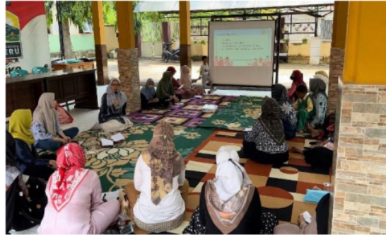
Gambar 2. Pelaksanaan Sesi Pertama Kegiatan Abdimas

apabila produk dan merek sudah dikenal dengan baik oleh konsumen [9]. Narasumber juga meneruskan pendapat dari Octasylya [10] bahwa kemasan ( packaging ) adanya estetika, ketahanan dan keamanan dapat meningkatkan nilai jual dan citra produk