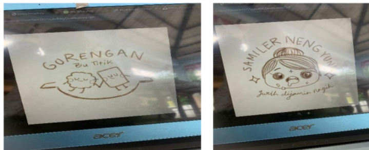
Gambar 5. Contoh hasil pendampingan berupa desain awal label usaha.

Dari hasil konsultasi dan pendampingan didapatkan contoh – contoh desain label sebagai dapat dilihat pada gambar 5. Evaluasi dari pelaksanaan kegiatan dilakukan, dapat disebut bahwa kegiatan telah terlaksana sesuai perencanaan yang telah disusun, hal tersebut 19 at diketahui dari pengamatan dan juga lembar evaluasi yang diisi oleh peserta setelah acara seperti nampak pada Tabel 4.