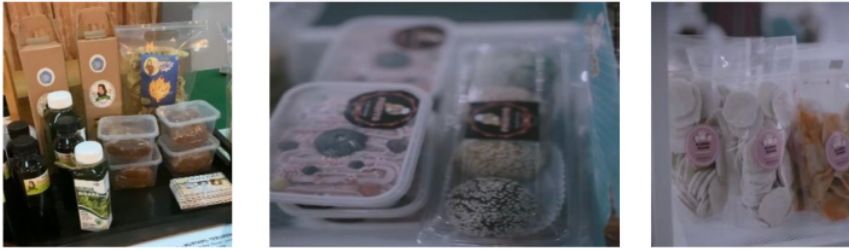
Gambar 7. Tampilan produk setelah mengikuti edukasi dan pendampingan kemasan dan label usaha

Meskipun kegiatan abdimas ini berlangsung lancar dan sesuai dengan tujuan, akan tetapi yang menjadi catatan dari capaian kegiatan abdimas ini adalah: