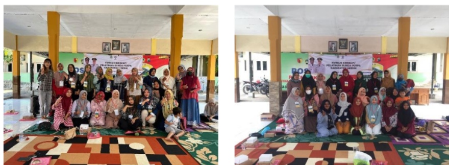
Gambar 6. Antusiasme peserta Bunda Puspa dari Desa Banyuurip mengikuti kegiatan

Dari sisi peserta, terdapat kendala teknis yang terjadi pada hari kedua, di kala diskusi dalam rangka melayani konsultasi desain, alokasi waktu yang diberikan per 1 orang peserta sekitar 30 sd 45 menit ternyata kurang, karena tidak jarang peserta tidak terbuka. Memberikan penjelasan pendek – pendek bahkan ada yang menyatakan “terserah” atau menyerahkan sepenuhnya desain pada mahasiswa yang membantu mendesain logo dan label untuk usaha mereka. Hal ini tentunya akan menyulitkan tim karena tidak mendapatkan gambaran yang jelas akan produk usaha yang mereka jalankan. Solusi yang dilakukan adalah membuat suasana diskusi senyaman mungkin, tim abdimas tidak langsung menanyakan tentang usaha mereka, namun menanyakan hal – hal ringan seputar mereka dan keluarganya, baru masuk pada pokok diskusi. Tim abdimas pun meminta bantuan peserta lain untuk menemani peserta yang memiliki kendala agar mau terbuka mengungkapkan keinginan atas desain logo dan label produk usaha mereka.