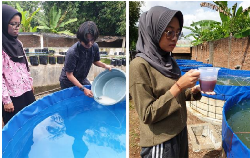
Gambar 3. Pembuatan media penumbuhan bioflok dalam kolam

Kegiatan pendampingan dilakukan secara terjadual untuk membimbing Pokdakan Mina Bangkit dalam pembenihan ikan gurami, misalnya dalam hal manajemen pemberian pakan dan kualitas air. Agar kebutuhan nutrisi dan pakan benih ikan gurami tercukupi, perlu dilakukan manajemen pemberian pakan yang tepat. Benih ikan gurami diberi pakan dengan dosis 10% dari bobot ikan. Kandungan protein pakan ikan yang digunakan sekitar 40%. Hal ini dimaksudkan agar kebutuhan nutrisi untuk pertumbuhan benih ikan tercukupi. Selain itu, kebutuhan pakan alami benih ikan gurami juga terpenuhi dari bioflok yang tumbuh di kolam ikan.