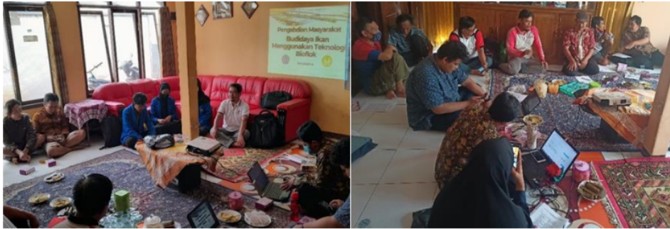
Gambar 1. Kegiatan pelatihan pembenihan ikan gurami menggunakan teknologi bioflok.

kolam dan media penumbuhan bioflok, mulai dari penyiapan bahan dan peralatan, proses pembuatan kolam dan media bioflok, pemeliharaan larva ikan gurami, dan manajemen kualitas air.