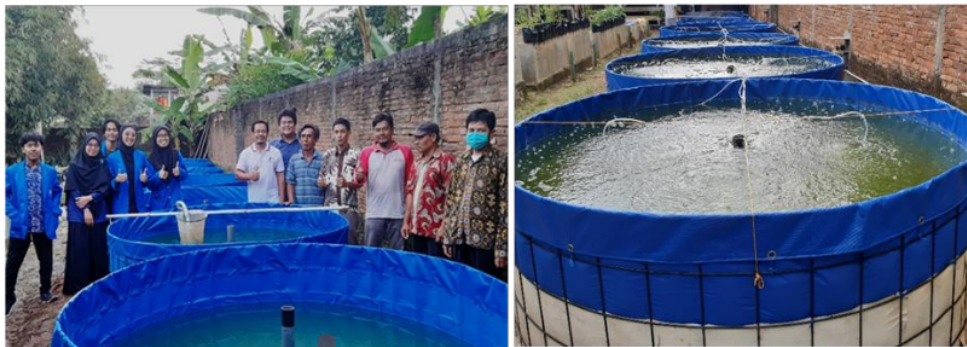
Gambar 2. Kolam bioflok untuk pembenihan ikan gurami yang dibuat anggota Pokdakan Mina Bangkit

Setelah kegiatan pelatihan selesai, dilanjutkan dengan mempraktikkan langsung pembuatan kolam bioflok berbentuk bundar dengan diameter 2 meter dan ketinggian 0,7 meter (Gambar 2). Pembuatan kolam bioflok dimulai dari pembuatan pondasi kolam, kemudian memasang dinding kolam dari besi hermes. Pada dasar kolam diberi alas dari bahan merang padi untuk menjaga kestabilan dasar kolam. Selanjutnya melakukan pemasangan terpal plastik dan pengisian kolam dengan air sumur sampai ketinggian 60 cm. Pada masing-masing kolam dipasang sistem aerasi sebanyak 4 titik. Hasil kegiatan praktik langsung telah berhasil membuat kolam bundar bioflok sebanyak 10 unit yang telah diisi air dan dilengkapi dengan sistem aerasi.