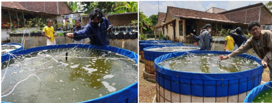
Gambar 4. Pengukuran parameter kualitas air pada kolam bioflok

Kondisi parameter kualitas air tersebut masih berada pada kisaran nilai kualitas air yang sesuai untuk pembenihan ikan gurami[18]. Kegiatan pengukuran parameter kualitas air kolam bioflok disajikan pada Gambar 4.