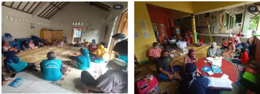
Gambar 3. Intervensi di Rumah Ketua RT

Penyuluhan dilakukan dengan media power point dan dibantu dengan proyektor agar masyarakat dapat melihat materi yang telah dipaparkan. Agar lebih dipahami, pemaparan materi juga dilakukan penyangan video mengenai hipertensi.