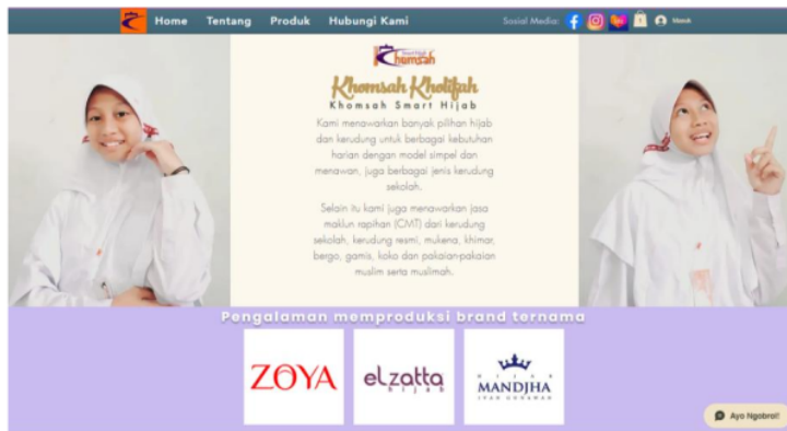
Gambar 4. Halaman Utama Website Khomsah Kholifah

Gambar 4. menampilkan tampilan website Khomsah Kholifah yang terintegrasi dengan semua sosial media perusahaan dan marketplace perusahaan.