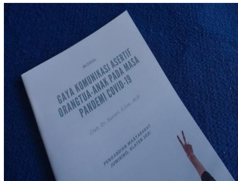
Gambar 3. Modul Gaya Komunikasi Asertif

Sebuah poster memiliki keunggulan sebagai media penyuluhan, yaitu: 1) citra visualnya mampu menyampaikan pesan secara cepat dan langsung; 2) mampu menjangkau sasaran lebih banyak; 3) dapat ditempel ditempat yang strategis dimana saja; dan 4) mudah dan cepat dimengerti, termasuk oleh mereka yang buta huruf. Media ini akan menjadi media yang gampang diingat oleh peserta, sehingga pesan lebih cepat diingat dan dipahami.