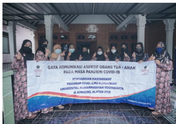
Gambar 4. Komunitas Sayang Anak

Pada dasarnya sebuah modul adalah materi pembelajaran yang bisa mengantarkan peserta kepada tataran operasional. Sebagaimana hal ini dikatakan oleh Erlely [3] bahwa modul pada dasarnya berisikan pemecahan masalah yang sedang dihadapi serta petunjuk atau rekomendasi teknis yang perlu dilaksanakan pada kegiatan secepatnya.