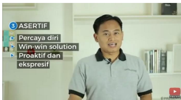
Gambar 1. Film tentang Ciri Komunikator yang Asertif

Penayangan film tentang akibat pertengkaran orang tua-anak dilanjutkan diskusi. Penayangan Film di sini bermanfaat sebagai media literasi dalam memahami relasi hubungan orang tua-anak serta manajemen konflik interpersonal. Setelah itu dilakukan diskusi dan simulasi tentang isi film. Dengan demikian orang tua yang bersangkutan dapat mengungkapkan kesulitan maupun keinginan terhadap kondisi anak. Gaya asertif semakin penting untuk mendapatkan perhatian dalam rangka mewujudkan iklim harmonis dalam keluarga.